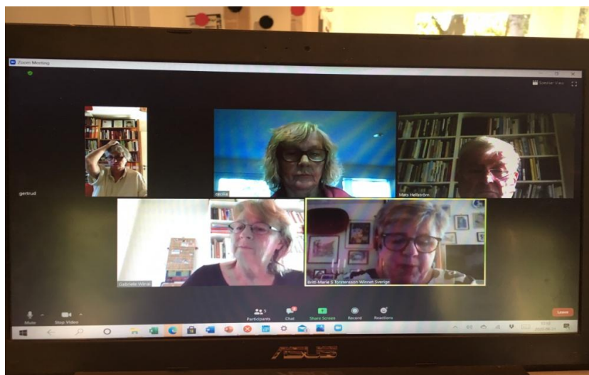
Svenska partnerorganisationer sammanträder