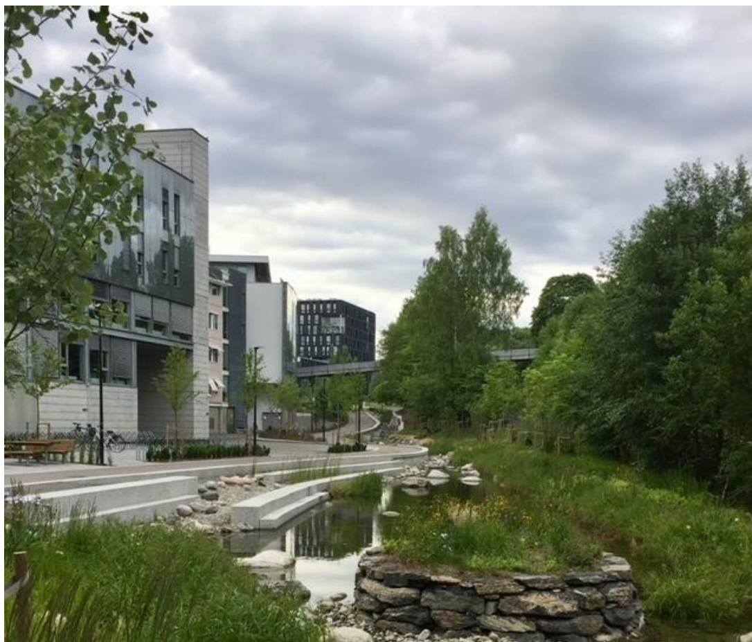
Forskningsparken i Gaustadbekkdalen.