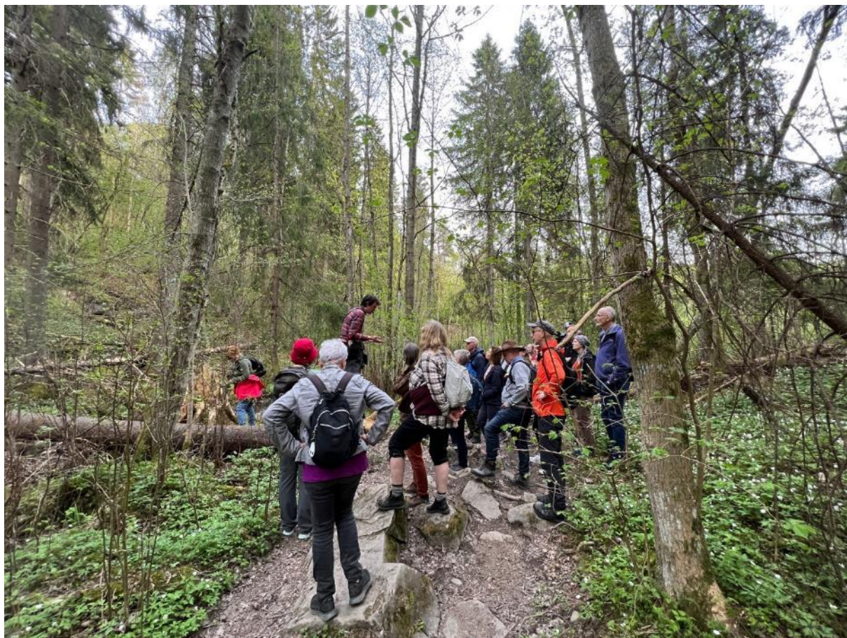
På tur langs Ljanselva.

Miljøprosjekt Ljanselva er en frivillig gruppe som har vært i aktivitet siden 1989. Vi har som hovedmål å virke til beste for elvemiljøet. Vernevedtaket (2003) er vår basis for arbeidet.