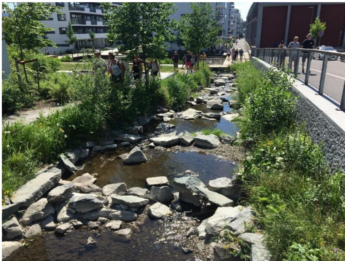
Hovinbekken over Ensjø er en suksess. Foto: Ekogruppen, Sverige, 2018

For å bevare og styrke Oslos blågrønne karakter må arbeidet med gjenåpning av elver og bekker være et premiss ved all byutvikling.