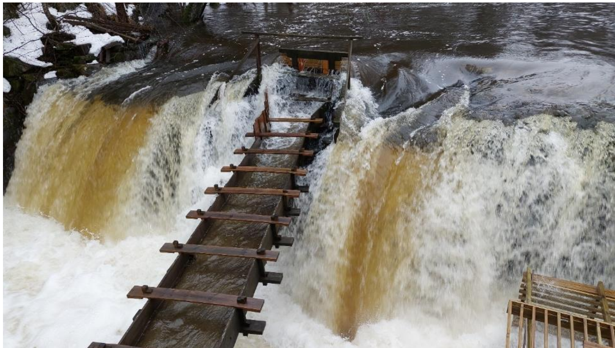
Flom i Gjersjøelva 1. mars 2024.

Årsrapport med blandede erfaringer: Det var i sommer et varierende antall besøkende. De fleste kulturarrangører har i sommer opplevd sviktende publikumsoppslutning, og dette gikk også utover oss. Folk har fått andre vaner under koronaen, og det har også frivilligheten generelt. Alle besøkende uttaler at de er imponert over hva vi har fått til, så hvordan får vi markedsført oss bedre?