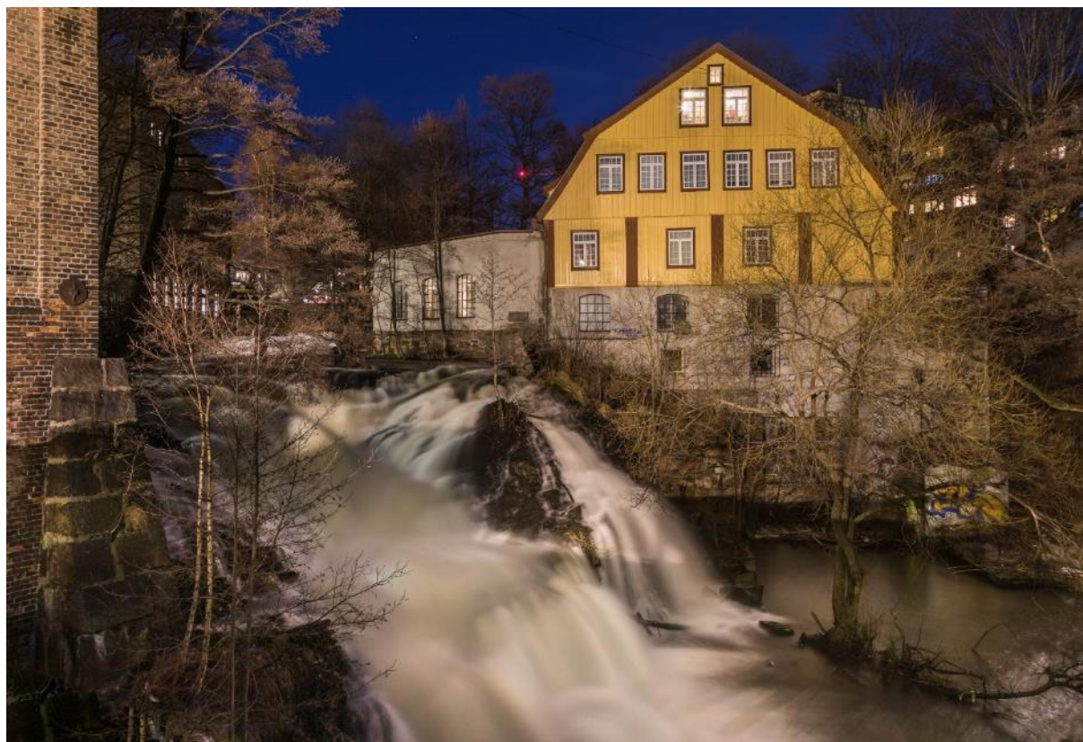
Glads mølle ved Akerselva.