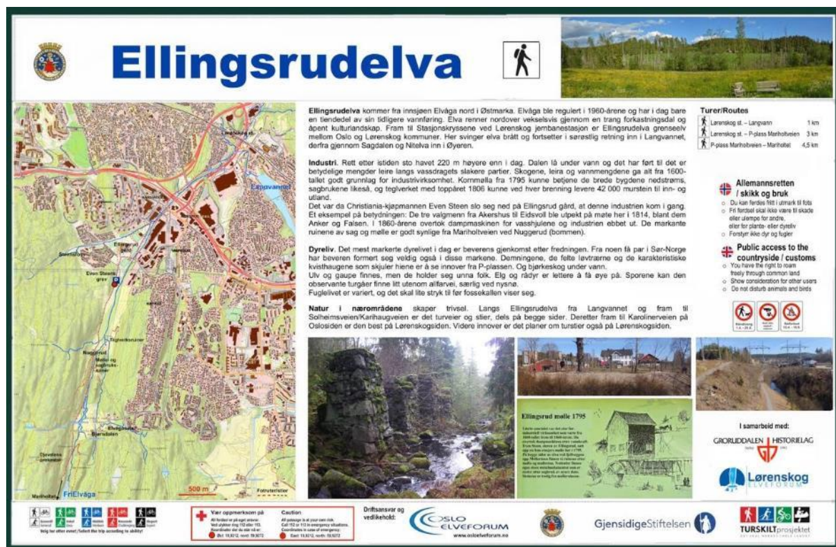
Tavle langs Ellingsrudelva satt opp av Oslo Elveforum

Ellingsrudelva har sitt utspring i Elvåga nord i Østmarka. Den renner nordover frem til Stasjonskrysset ved Lørenskog stasjon og danner grense til Lørenskog. Her svinger den inn i Lørenskog og til Langvannet, videre ned Sagdalen frem til Nitelva og Øyeren.