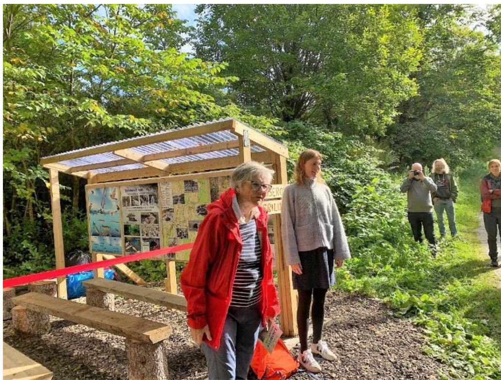
Åpning av «klasserom i friluft» ved Ljanselva 15/9 2022.