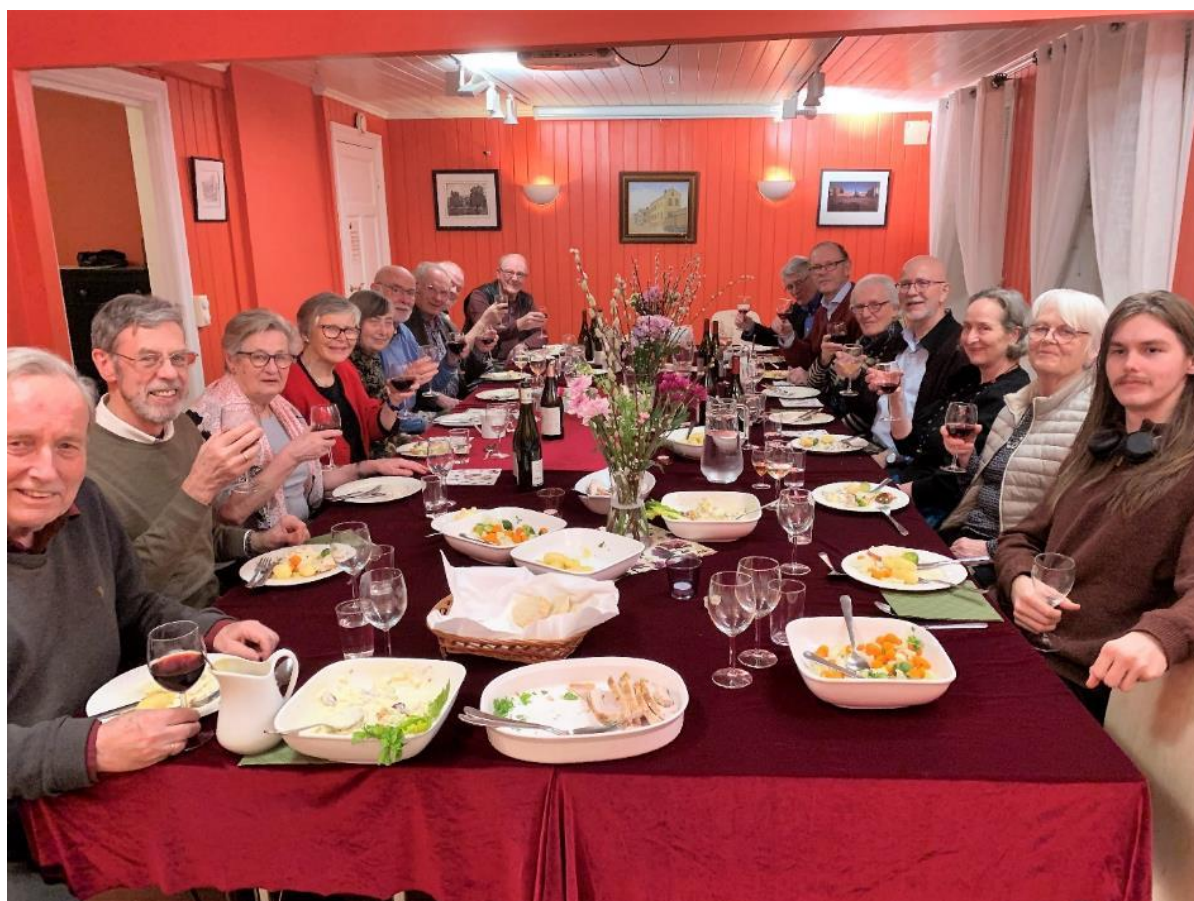
Styremiddag i Korsgata 16 i 2022.

Styret har i 2023 avholdt fem ordinære styremøter. På januarmøtet ble det servert middag. Det har vært godt oppmøte på alle styremøter.