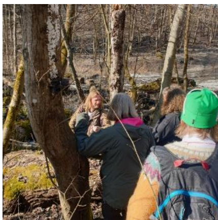
På tur langs Alna