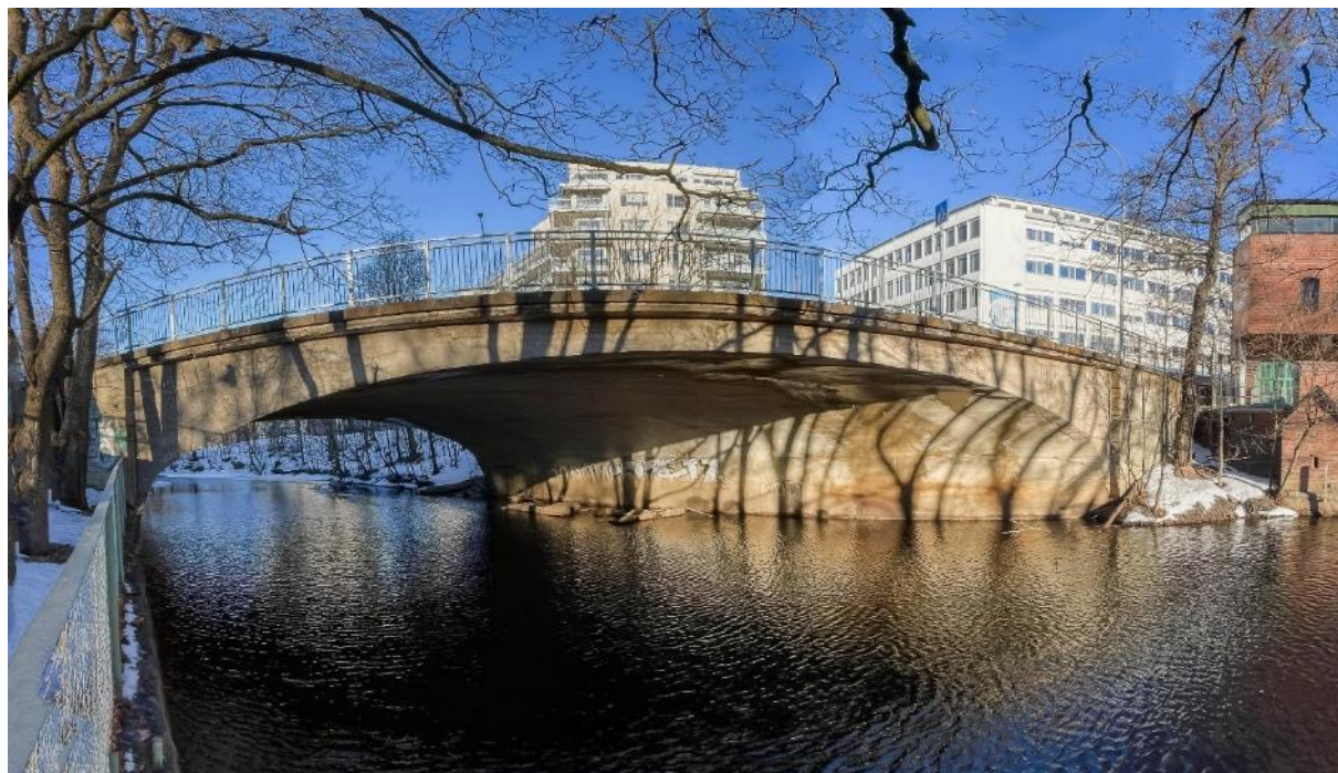
Treschows bru.

MAVs drift er i det alt vesentlige basert på medlemskontingent, grasrotmidler fra Norsk Tipping og gaver. I 2023 hadde MAV kr 62 082 i inntekter og kr 39 220 i utgifter, dvs. et overskudd på kr 22 862. Egenkapitalen pr. 31.12.2023 var kr 164 250, herav kr 163 450 på bankkonto i DnB. MAV er registrert i Enhetsregisteret og Frivillighetsregisteret.