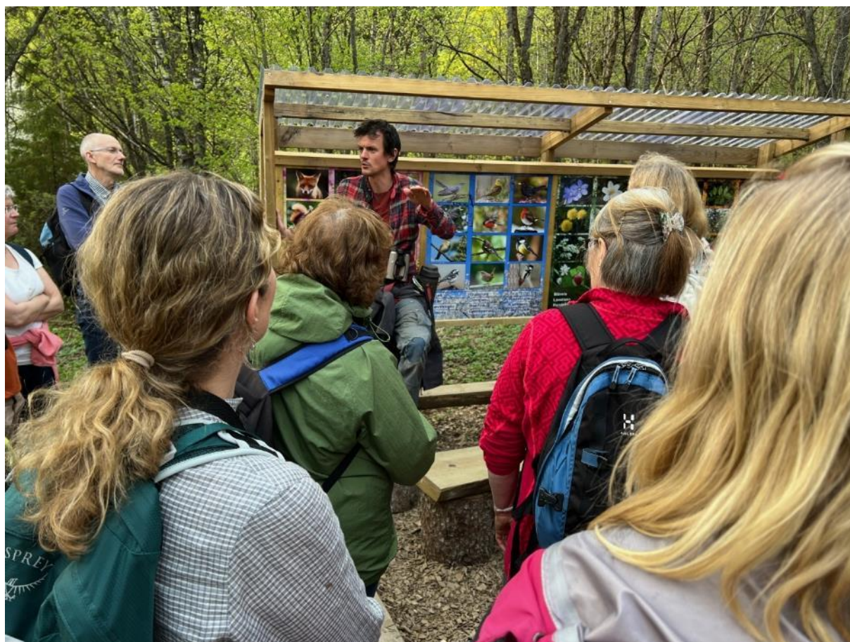
Klasserom i friluft.