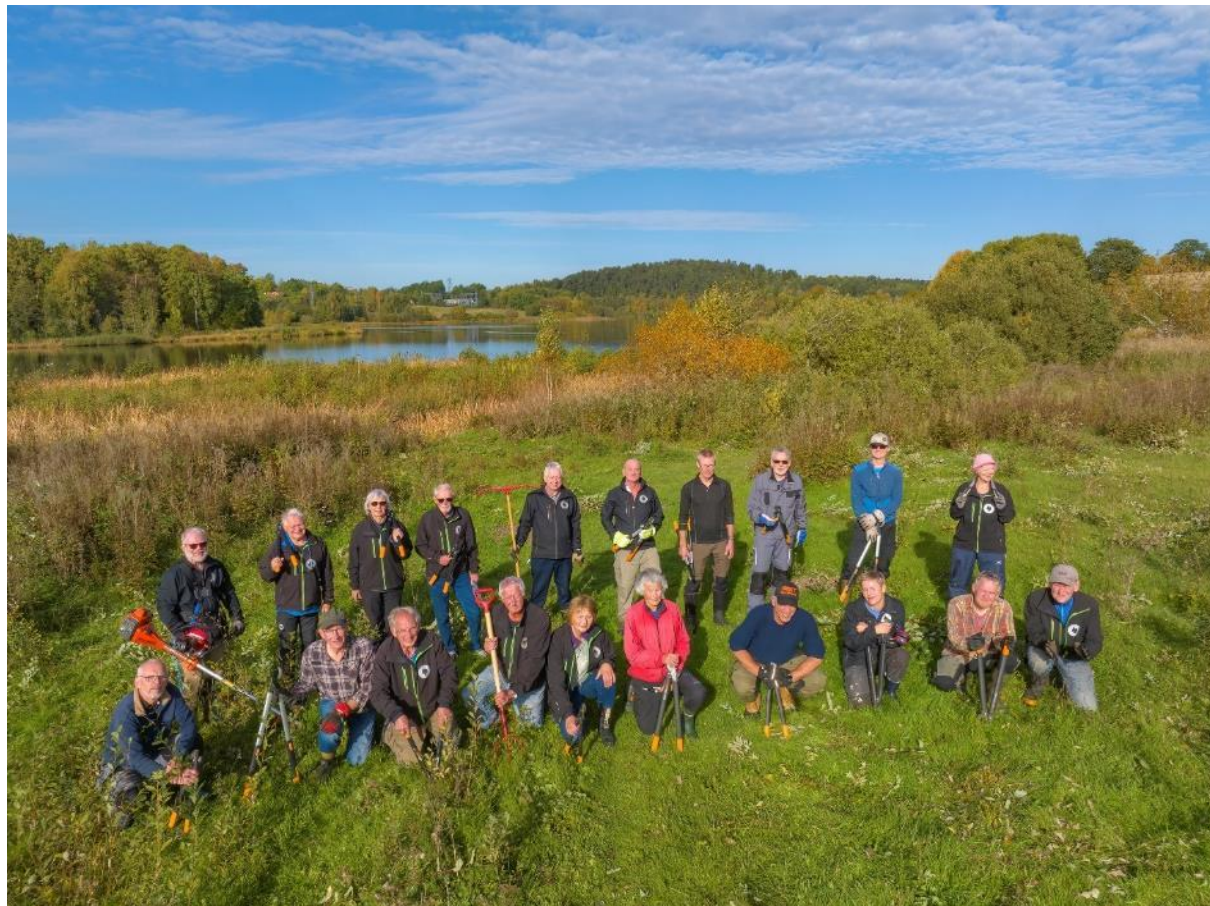
En gruppe fra dugnadsgjengen har stilt seg opp med Østensjøvannet i bakgrunnen.