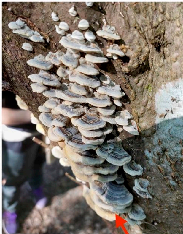
En trestamme med masse Silkekjuke.