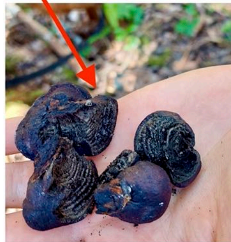
Kullsopp som lever på trær.