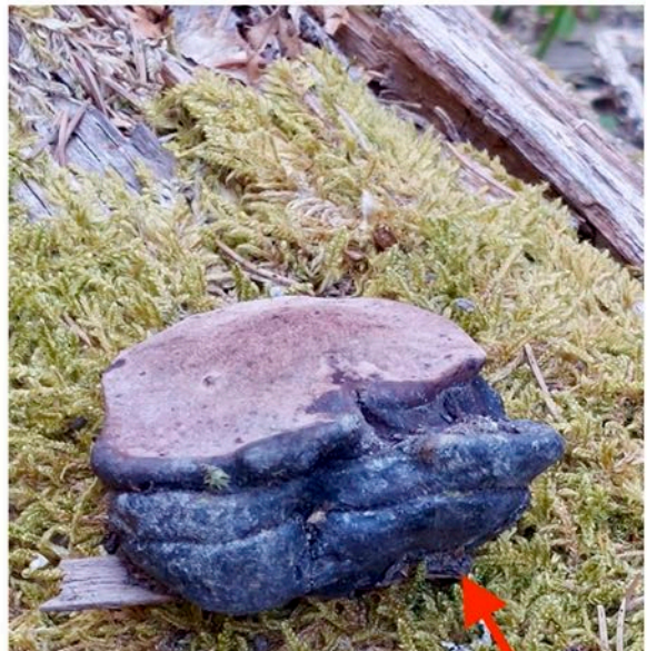
En sjelden og rødlistet Rosenkjuke.