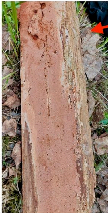
En ganske sjelden og rødliste kjuke som heter Sjokoladekjuke.