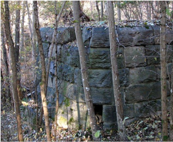
Rester etter Ljansviadukten