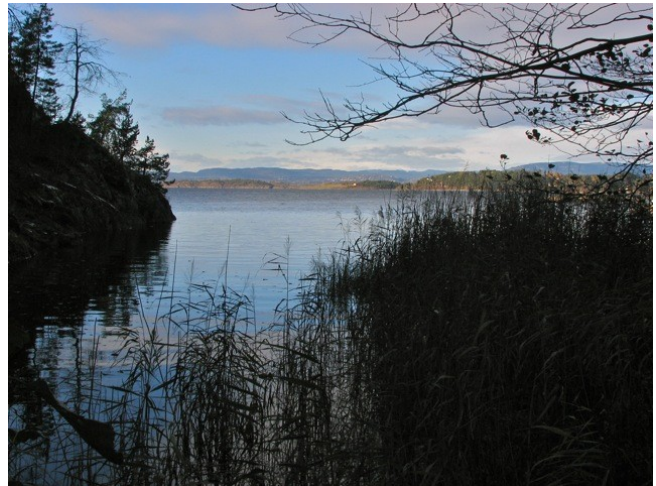
Ljanselvas utløp Mosseveien