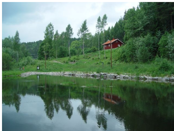
Sagstua, like fin hele året