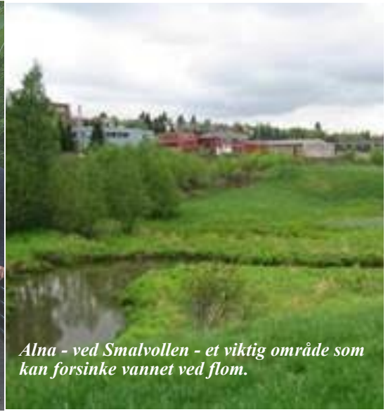
Alna - ved Smalvollen - et viktig område som kan forsinke vannet ved flom.