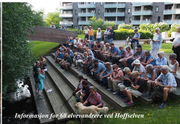
Informasjon for 60 elvevandrere ved Hoffselven