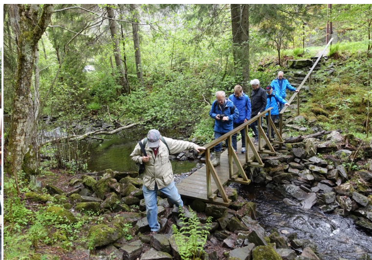
Befaring ved Ellingsrudelva og de gamle mølleruinene før Oslo Elveforums årsmøte 2016. Ellingsrudelva er grenseelv mellom Oslo og Lørenskog - og etter dette ble også Lørenskog Elveforum etablert!