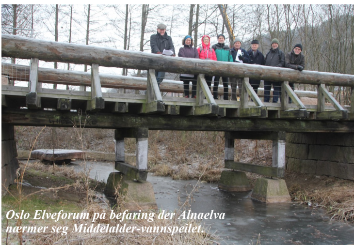
Oslo Elveforum på befaring der Alnaelva nærmer seg Middeltalder-vannspeilet.