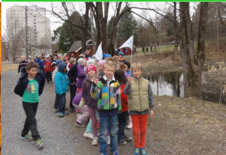
Smestad skole adopterte Hoffselva 3. mai 2013.