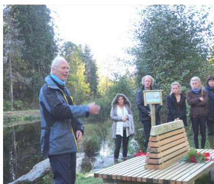
Minnemarkering med "Tors benk" ved Ljanselva (Sverre Samuelsen).

Vi arbeider for at Oslos vassdrag skal være friske og rene, åpne og tilgjengelige for byens befolkning