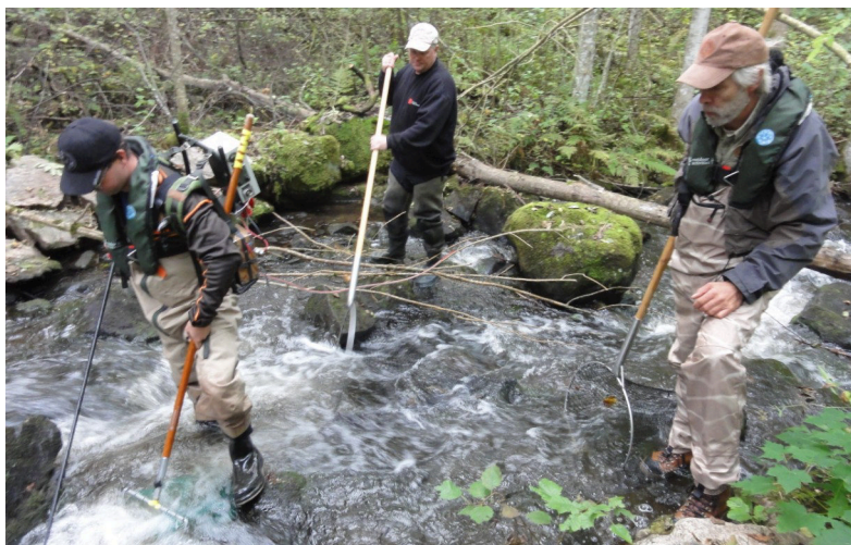
Elektrofiske med flytting av fisk fra Ljanselva til Gjersrudbekken.

Oslo vil være en bærekraftig by og en blågrønn hovedstad. Oslo Elveforum samarbeider nært med Oslo kommune, bl.a. gjennom "Samarbeids-forum for vassdrag". Bildene viser fuglekikker-skjul ved Østensjøvannet og undervisning av lærere ved Alna om vannkvalitet.