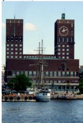
Oslo Elveforum deltar under Miljødagene i Oslo - bildet er fra Vannparaden 2006.

Hovedstaden i vannlandet Norge må forvalte sine vassdrag i samsvar med våre nasjonale miljømål — og gjenåpne elver og bekker der det er mulig.