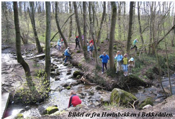
Bildet er fra Hovinbekken i Bekkedalen.