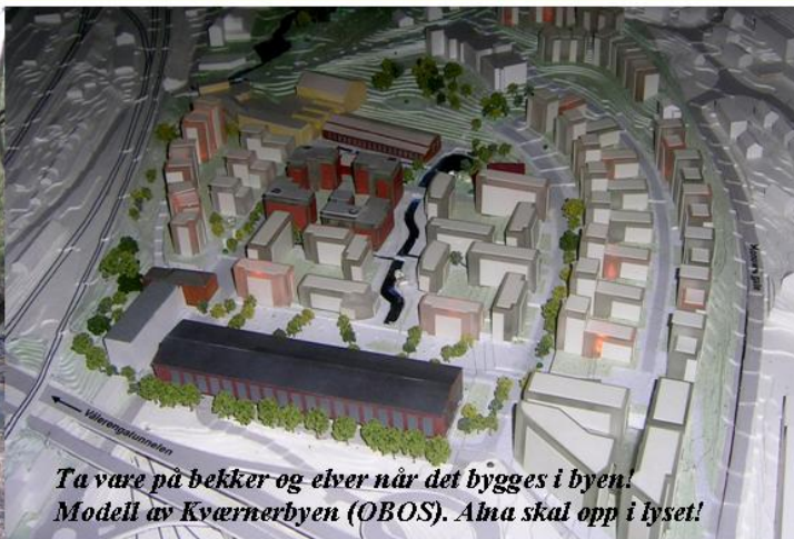
Ta vare på bekker og elver når det bygges i byen! Modell av Kværnerbyen (OBOS). Alna skal opp i lyset!

Det skal utarbeides egne planer for hver av Oslos elver i samarbeid med Oslo kommune, Oslo Elveforum og berørte bydeler og rettighetshavere for å sikre en samordning av brukerinteressene knyttet til vassdragene. (Byøkologisk program 2002-2014, punkt 3.2.2.).