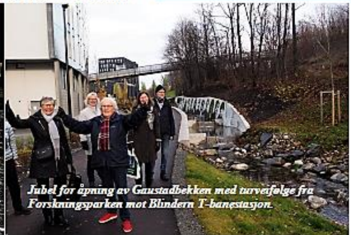
Jubel for åpning av Gaustadbekken med turveifølge fra Forskningsparken mot Blindern T-banestasjon.