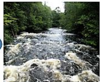
Kommunedelplanen for Lysaker-vassdraget ble vedtatt av Oslo Bystyre i juni 2017.

Lysakervassdragets Venner har stått på: Mange års arbeid inkludert befaringer og guiding med politiske grupperinger, har båret frukt!