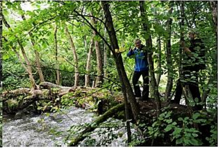
Naturen har laget sin egen bro over Alna i Svartdalen. Alnaelvas Venner arrangerer turer som er åpne for alle langs Alna og sidebekkene. Det største arrangementet er den årlige lysvandringen.