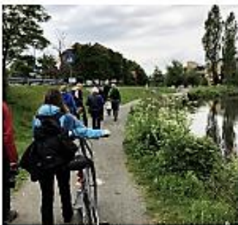
SaFoVa på befaring langs Hoffselven, her ved Øvre Smestaddam.

Oslo vil være en bærekraftig by og en blågrønn hovedstad. Oslo Elveforum samarbeider nært med Oslo kommune, bl.a. gjennom Samarbeidsforum for vassdrag - SaFoVa.