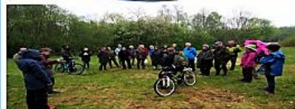
Fra fugletittetur langs Ljanselva i mai ved Hauketo!

Lysakervassdragets Venner har stått på: Mange års arbeid inkludert befaringer og guiding med politiske grupperinger, har båret frukt!