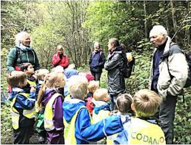
Oslo Elveforum ønsker å inspirere flest mulig barn og unge til å bruke elver og bekker og områdene omkring som kilder til kunnskap om miljø og økologi. Her langs Ljanselva.