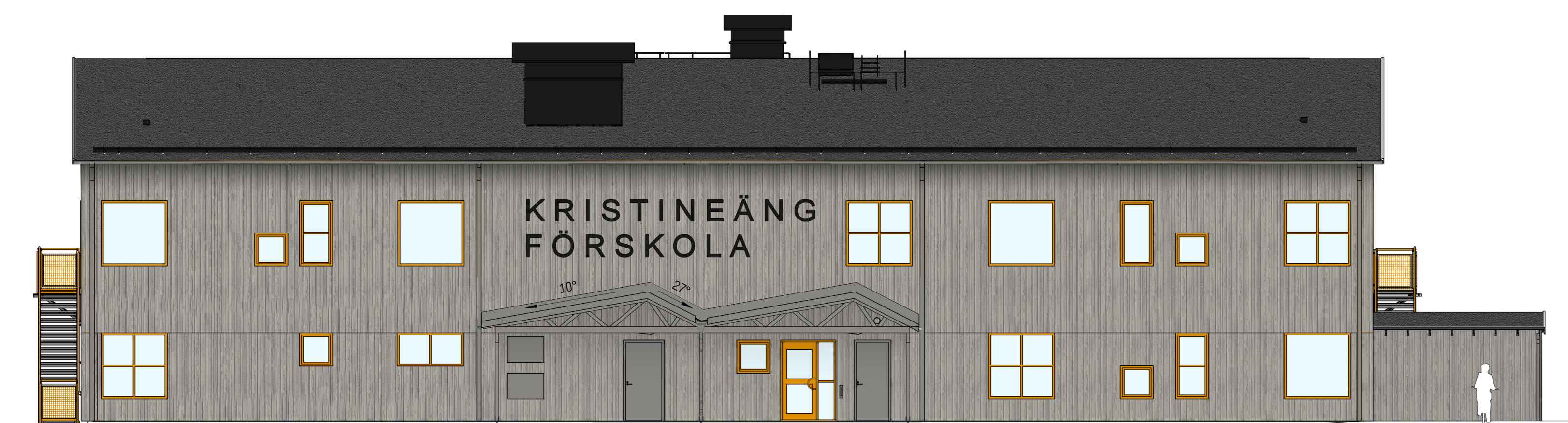
FASAD C (MOT ANGÖRING)