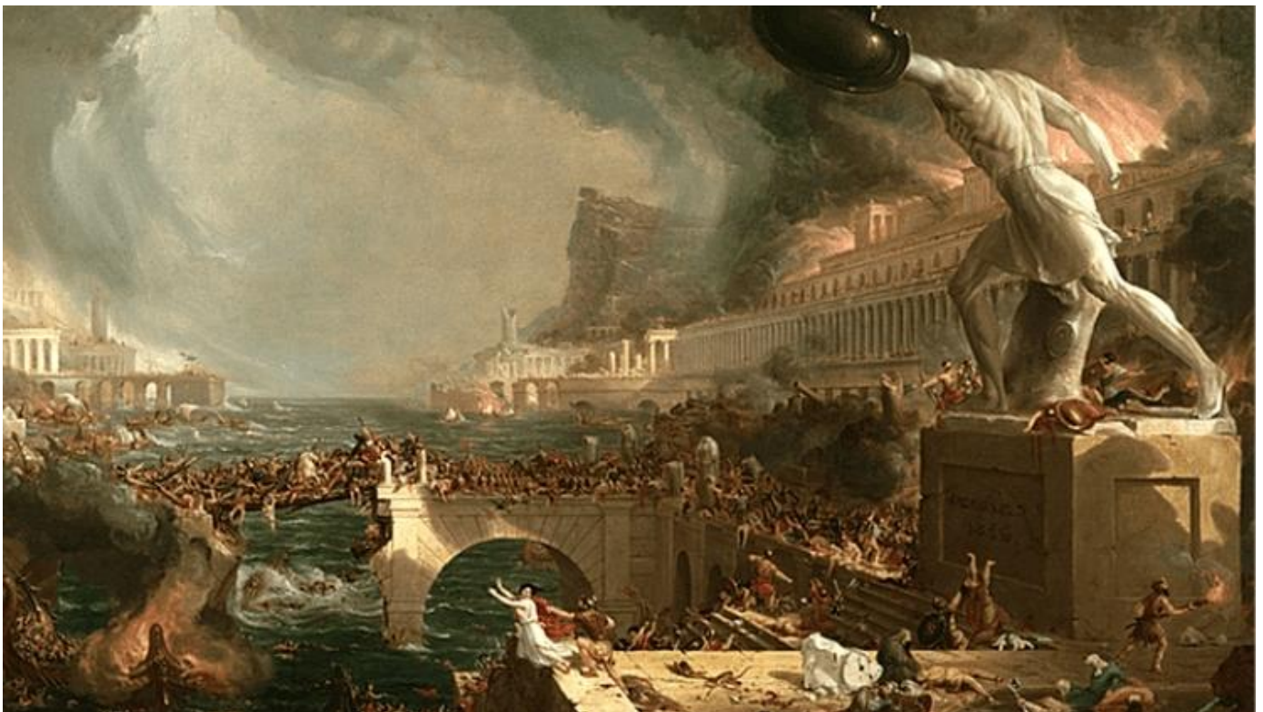
Destruction from The Course of Empire (1836) | Thomas Cole

Para Rose, “Francis queria que seus leitores vissem no liberalismo um projeto coordenado de desapropriação cultural contínua” que destruiria “todos os símbolos e instituições de uma ordem social mais antiga: “lealdade nacional, moral tradicional, heróis e fundadores da cultura americana” (p.122).