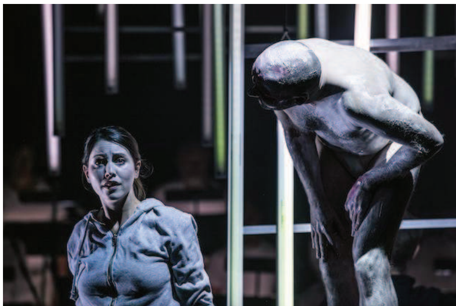
Nordkraft som opera

Der er pr 10.1.22 ansat en administrativ producent på \frac{3}{4} tid.