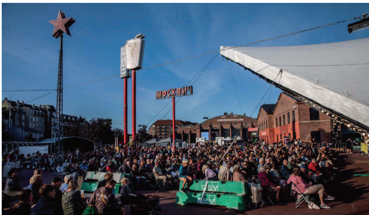
FESTIVALSCENEN - Operaen møder nye publikumsgrupper – lige præcis der, hvor de er og føler sig hjemme