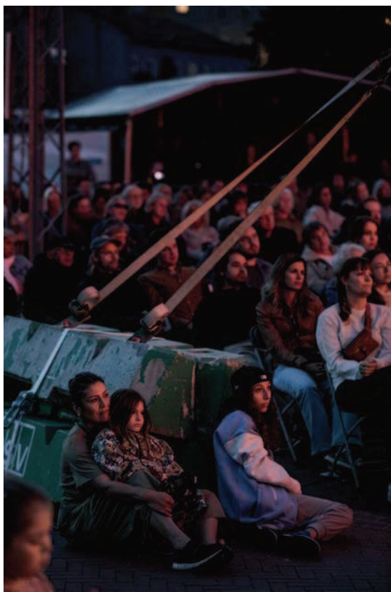
Publikum til Pagliacci på Festivalscenen

Udover ovennævnte trak Festivalscene på Den Røde Plads med gratis entré 6.100 publikummer samlet over seks dage. De største publikumstal for Festivalscenen så vi i åbningsweekenden, hvor vi havde Viva Verismo! -koncerten med TIVOLI Copenhagen Phil, Søholm Operas Pagliacci og en søndag i familiens tegn med festivalens egenproduktion H.C. Andersens operaeventyr og en kostume- og scenografi workshop for børn. Vi har ikke konkret data på publikumssammensætningen, men vores oplevelser fra stedet og billederne viser os, at publikum var meget divers. Vi fik utroligt mange positive tilbagemeldinger fra publikum og havde både de gæster, der var på Den Røde Plads for første gang og de, der var til opera for første gang.