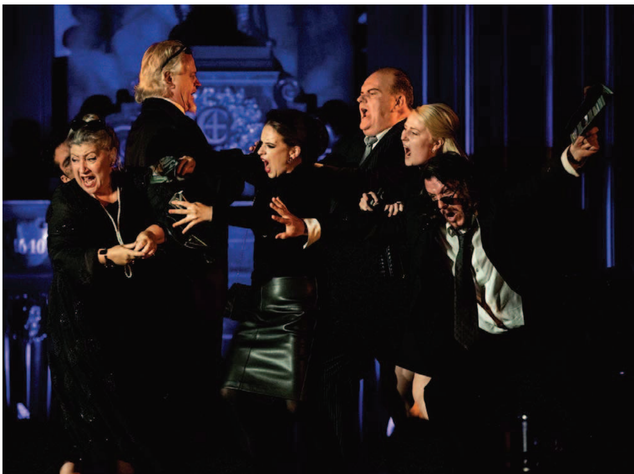
Gianni Schicchi i Børssalen

Denne djævelsk henslængte Puccini på Børsen er opera på første klasse, men også afvæbnende komik, der rammer lige hvor den skal. Sceneblog.dk