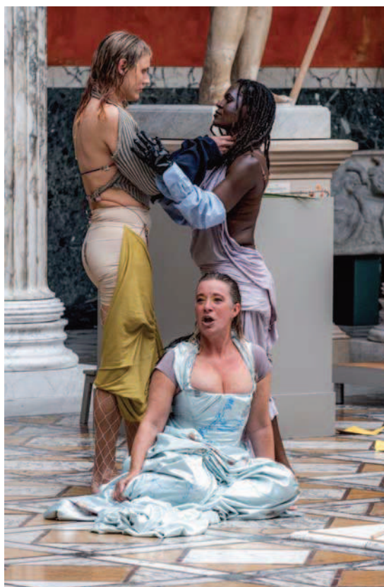
Dryppende Stof på Glyptoteket