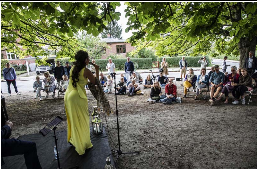
Et blandt 100 opera-øjeblikke.