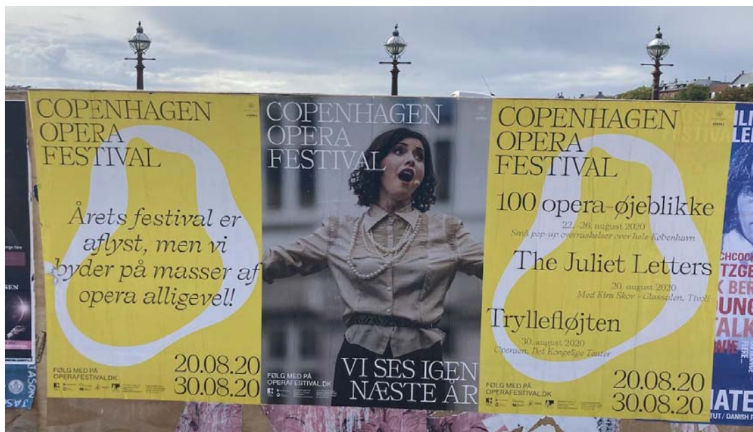
Den nye visuelle identitet i gadebilledet. 9

Festivalen lavede en kort film om årets 100 opera-øjeblikke som kan ses her.