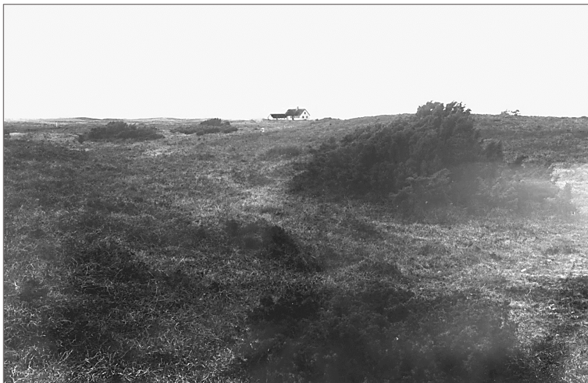
Figur 3: Endnu først i 30'erne så der ud, som hele Lyngen havde set ud i århundreder, her på Ellinge Lyng et par kilometer nord for Smidsholmvej. Sjællands Odde kan anes i baggrunden. Huset er typisk for egnens byggeskik.

til underlag (jfr. Højby kirke), lige op til 19. årh. lå hen som hedeparter, tilhørende mange landsbyer; selv sådanne, hvis jord ikke nåede ud til stranden, som Tengslemark, Højby og Vig, havde deres »Lyng«. »Kongeparten« var statens; af Ellinge Lyng indtog den 1799 230 tdr. land til skovplantning; Jyderup skov er derimod dannet 1843 af fire nedlagte fæstegårde, Usselvang. Ellinge plantage er såre tarvelig; der er meget stærk mår; træernes højde er meget ringe. Jyderup skov har nok mager jord, men granerne når dog nogle steder en anselig størrelse, og enkelte steder er der pæne bøge. Bøndernes fællede er for største delen udstykkede