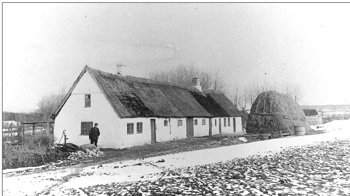
Figur 6: Bødkerens hus lå på nuværende adresse Skoobakken 2, lige bag "Lausminde" på Strandlystvej. Det kaldtes "Penalhuset". Billedet er fra 1905 og viser et typisk husmands- og håndværkerhus på Lyngen på den tid. I baggrunden tv. Jyderup Skov, th. højdedraget øst for Høve Stræde.

Men så er der det med bopælen, og det hænger sammen med københavnernes. Da de begyndte at komme hertil, var folk på egnen ikke særlig begejstrede for dem, og de ville ikke sælge mælk og grøntsager, eller andre sager, til dem. De var bange for at blive snydt. Men jeg tog alligevel venligt imod dem, og begyndte at handle med dem.