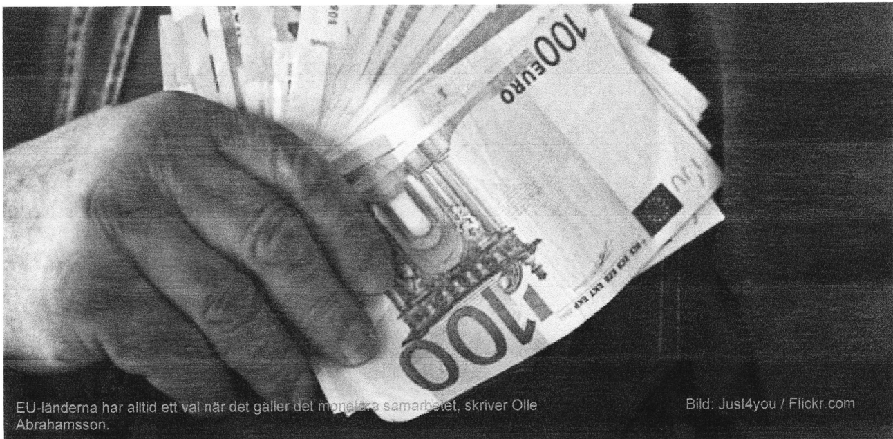
EU-länderna har alltid ett val när det gäller det monetära samarbetet, skriver Olle Abrahamsson.

Publicerad: 1 apr 2011 kl 11:21 Uppdaterad: 1 apr 2011 kl 11:24