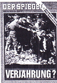
Preskription? Der Spiegel den 16 mars 1965.

De hundra senaste understreckarna. • svd.se/understrecket