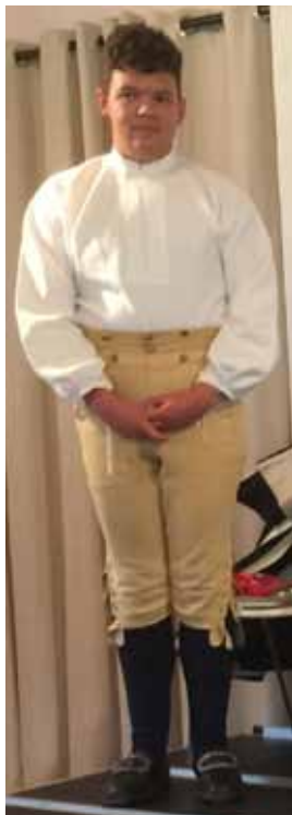
Sämskskinnsbyxor som knäpps under knä.

Några bilder från Eriks och Annas visning till föredraget av Erik Thorell på Olaus Laurentii Släktförenings årsmöte i Bodarna den 2 juli 2016.