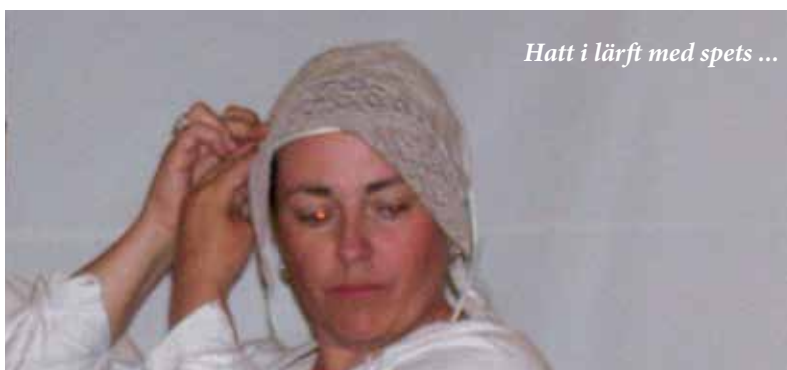
Hatt i lärft med spets ...