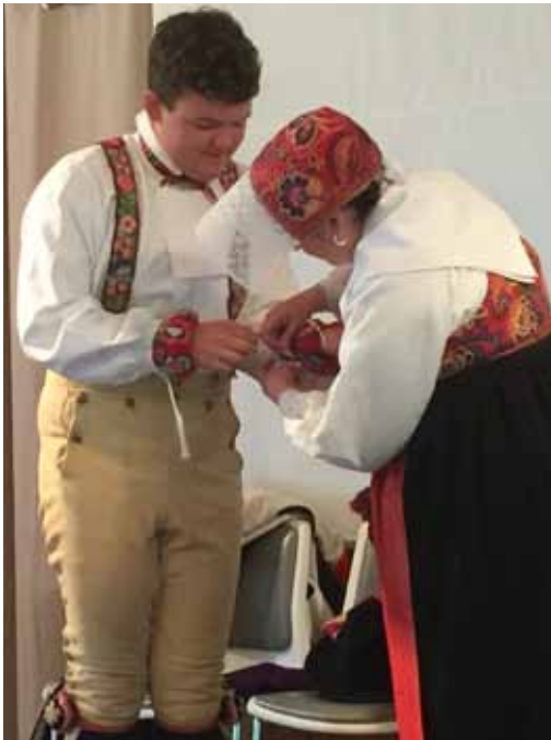
Eriks halskläde, handringar och hängslen.