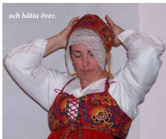
och hätta över.