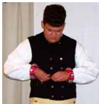
Livstycke/väst, rock och hatt.