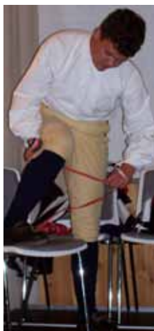
Sockband med toppor.