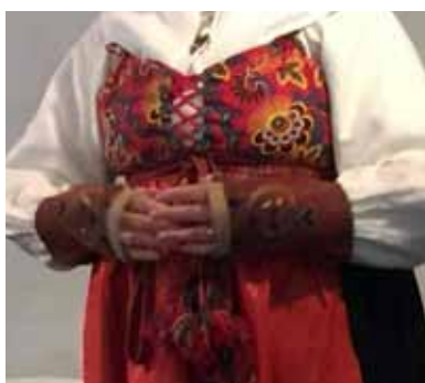
Broderade halvhandskar och bokkläde för psalmboken.