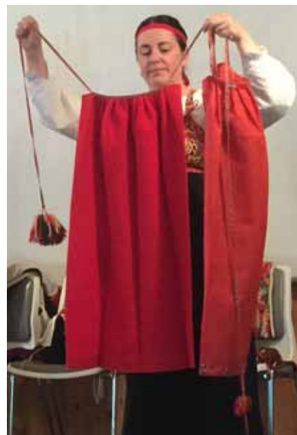
Förkläde med kringomband.