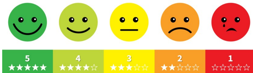
Afbeelding 2. Smileyborden voor de spiegelbeeldoefening.

Het reageren aan de hand van de smileyborden, betekent het volgende: 5= helemaal mee eens, 4= mee eens, 3= neutraal, 2= niet mee eens en 1= helemaal niet mee eens.