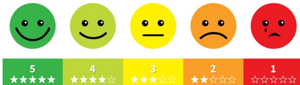
Afbeelding 2. Smileyborden voor de spiegelbeeldoefening.

De spiegelbeeldoefening is ontstaan doordat er in gesprekken met de opdrachtgever en de ouders naar voren kwam, dat de kinderen niet bij het intakegesprek aanwezig zijn. Dit vonden we wel van belang, aangezien OBIC zich richt op ouders van kinderen die ADHD of autisme hebben. De missie was dat ouders en kinderen zich begrepen, geliefd en gezien voelen. Om dit te creëren is het ook van belang om te weten wat de behoeften van het kind zijn. Een manier om de ouders inzicht te geven in hun eigen aandeel in de problematiek en dynamiek waarvan ze deel uitmaken, is dan ook door een spiegel voor hun gezicht te houden. Deze spiegel is het kind. Het idee is om de kinderen stellingen voor te leggen die te maken hebben met hun gevoel en met de opvoeding die ze krijgen (zie bijlage 4). Aan de hand van smileys (zie Afbeelding 2) geven de kinderen aan in hoeverre de stelling op hen betrekking heeft. Het gebruik van smileys is voor een kind een laagdrempelige en speelse manier om te antwoorden.