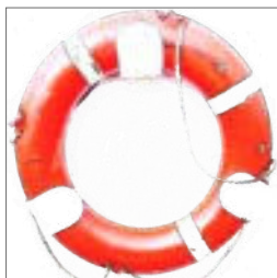
Forsikring s. 5