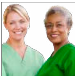
Dialyse i udlandet s. 8