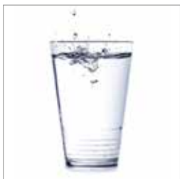
Forebyggelse s. 11