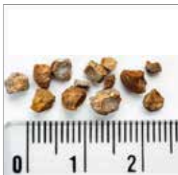
Hvad er nyresten? s. 4