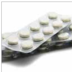
Behandling s. 8