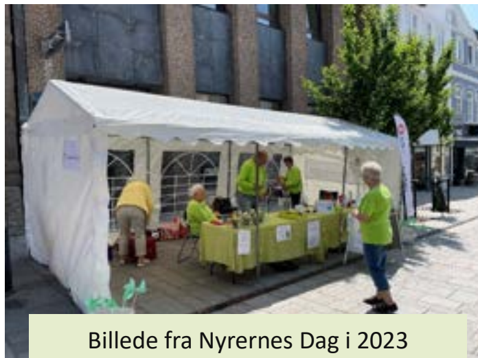
Billede fra Nyrernes Dag i 2023

Det indeholder budskabet om hvor vigtigt det er at passe på sine nyrs sundhed samt gode råd til hvordan man kan gøre det.