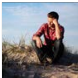
Hvor afklaret er du? s. 14