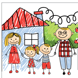
Børnefamilie? s. 7