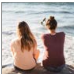
Min ven er syg s. 8