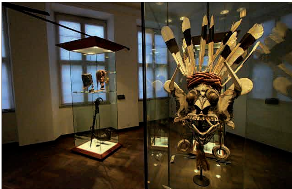
Figur 1. Eksempel på Nationalmuseets etnografiske udstilling. 4

Værdibegrebet kan bruges på flere områder i en kultur-arvssammenhæng, dels omkring formidlingen af historien/kultur-arven, dels i forhold til bevarelsen af kultur-arven/bygninger og ruiner. Kigger man på formidlingen