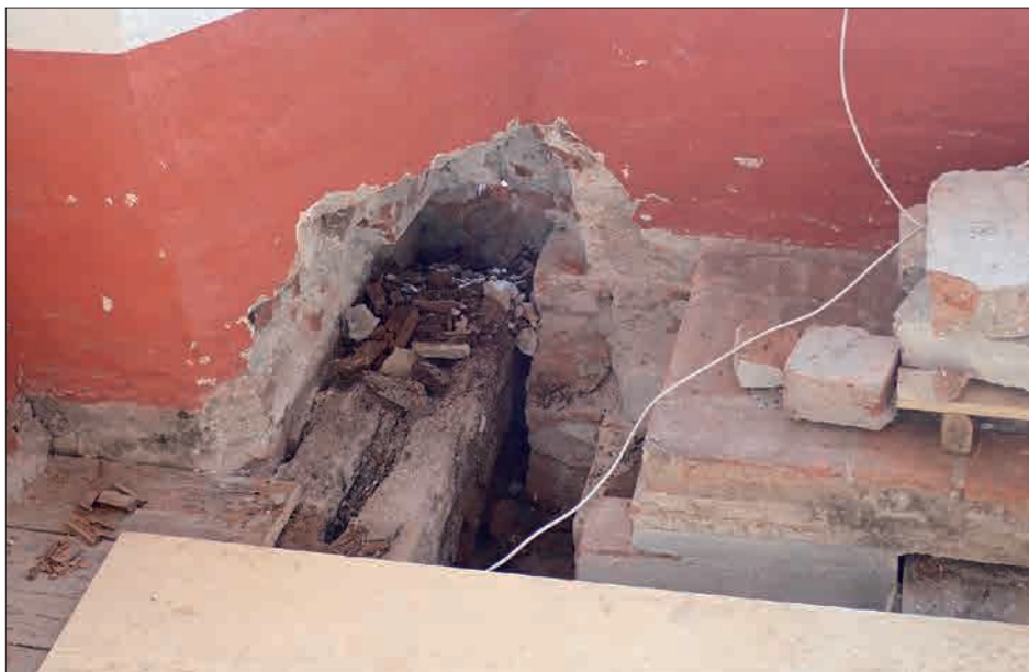
Figur 4. Smuldrende bjælkeende, Nyborg Slot februar 2018.

Efter at man modtog konklusionerne fra forundersøgelserne i august 2014, begyndte arbejdet på konkurrenceprogrammet for alvor. Østfyns Museer stod for meget af den tekst, der skulle i programmet, bl.a. den historiske baggrund, bygningshistorien og de funktionskrav, museet havde til de nye bygninger. Derudover blev