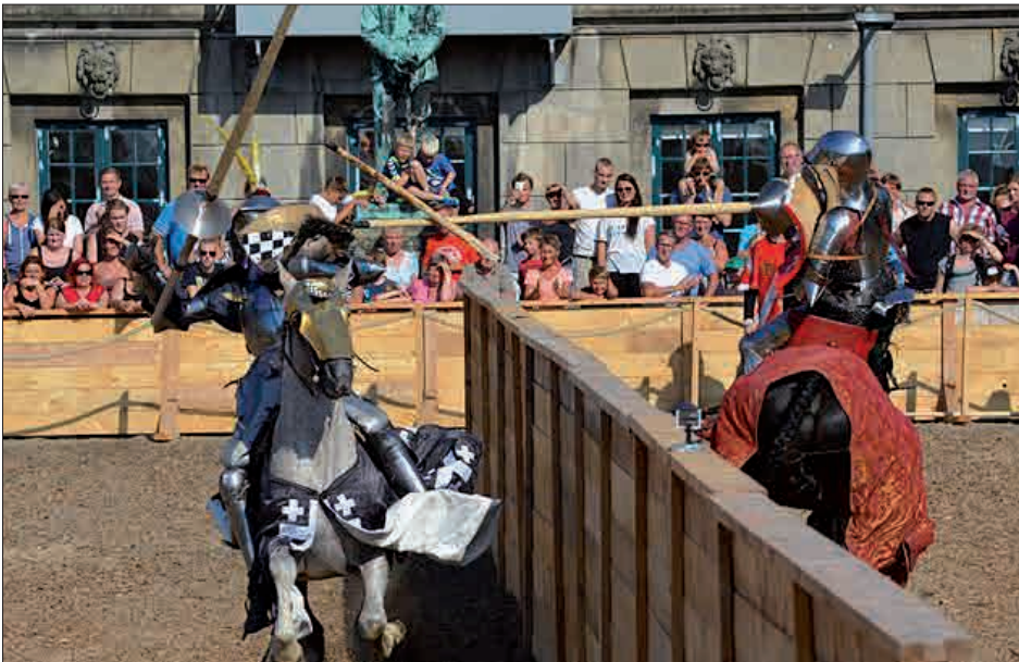
Figur 2. Danehof 2014.

Østfyns Museers afdeling i Nyborg varetager den daglige drift og formidling af slottet og Borgmestergården. Det er museet og de tilknyttede frivillige, der formidler slottets, fæstningsanlæggets og byens historie til alle interesserede; til lokale borgere, skoler og turister. Det er desuden museet, der står for den faglige og stedspecifikke viden og forskning, både hvad gælder den historisk-arkivalske og den arkæologiske forskning i forbindelse med slotsprojektet. Museet og Nyborg Kommune har også stor suc-