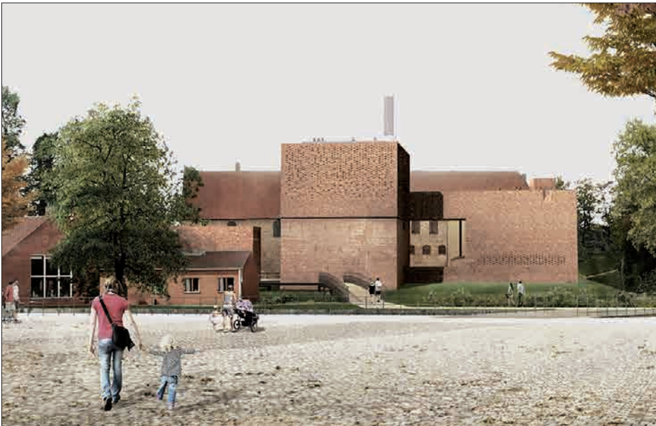
Figur 3. Det nye Nyborg Slot set fra Torvet. Visualisering: Cubo Architects A/S.

Den nye epoke (slotsprojektet) blev til i et ønske fra museets side om en gennemgribende restaurering, og efter fusionen til Østfyns Museer begyndte en vision at tage form. Den