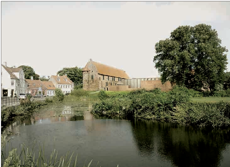
Figur 8. Det nye Nyborg Slot set fra sydøst. Visualisering: Cubo Architects A/S.

I november 2018 ventede projektet på de sidste tilladelser og dispensa-