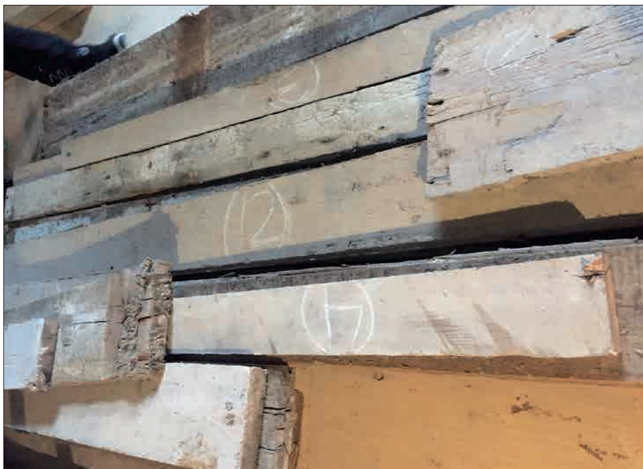
Figur 7. Nummererede gulvplanker, Nyborg Slot september 2018. Foto i privateje.

Planen for den første fase af restaureringen er, at den skal afsluttes i foråret 2019, hvorefter man kan begynde på den anden fase med borgens indre. Her vil man bl.a. indlægge varme i 1. stokværk for på den måde at kunne kontrollere temperaturen i slottet og sørge for, at den ikke svinger ud over de rammer, som