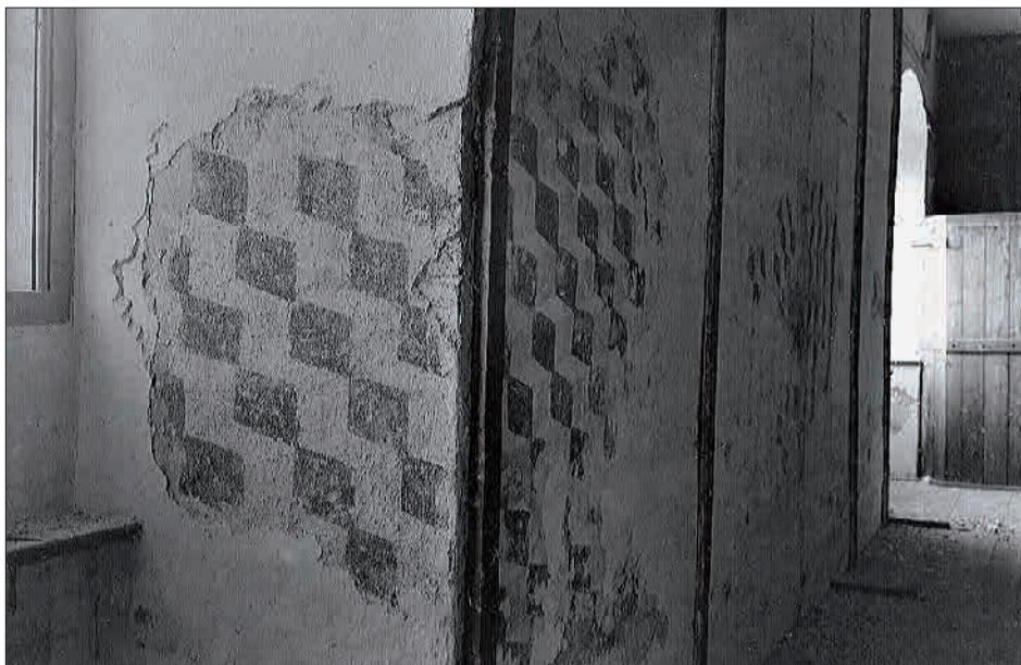
Figur 6. Vægmonster bag puds, Clemmensens restaurering.

Restaureringen og slotsprojektets fjerde fase blev startet med et pilotprojekt i januar 2018 med det formål at finde den bedste løsning til restaureringen af bjælkeenderne. Dette var vigtigt, for at man fik den nødvendige viden i forhold til at sende