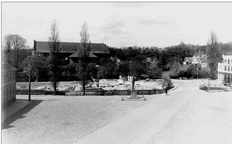
Figur 5. Nyborg Torv ca. 1938. Rigets hovedstrøg fornemmes stadig. Kommandantgården er under nedbrydning for at gøre plads til det nye bibliotek. Sammenlign med figur 3 side 43.

I den periode arbejdede arkitekter og ingeniører med i alt otte kommentarer, som dommerkomiteen kom med til det vindende forslag. 41 I dommer-