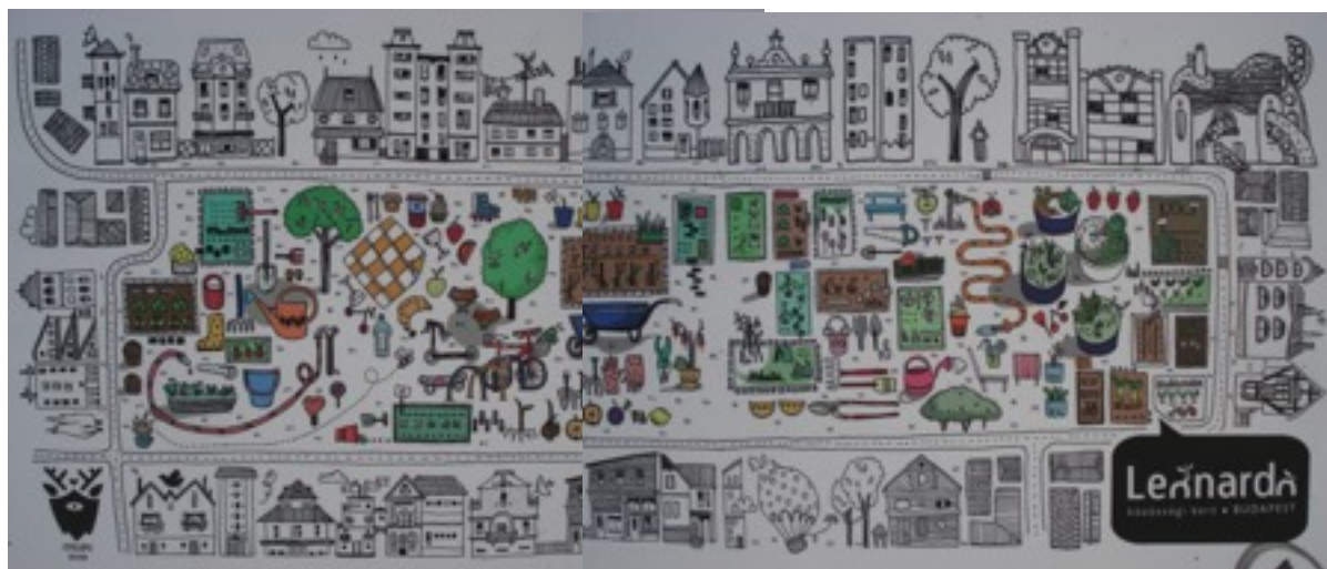
Dessin d'un jardin collectif à Budapest