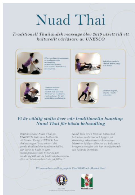
“โปสเตอร์ โพรโมตนวดไทย”

เพื่อให้การสื่อสารกับลูกค้าชาวสวีเดน เป็นไปอย่างน่าเชื่อถือและเป็นมืออาชีพ ไทยไวส์จะพัฒนาสื่อ ทั้งสิ่งพิมพ์ ภาพ ความรู้เกี่ยวกับนวดไทย รวมถึงคลิปวิดีโอ ต่างๆ ในภาษาสวีเดนเพื่อให้คนไทยใน ธุรกิจนวดไทยในสวีเดนทุกคนสามารถนำไปใช้ได้ (สื่อสิ่งพิมพ์แจกเฉพาะในเมือง มัลเมอ) ซึ่งโปสเตอร์ เอกสารตั้งโต๊ะเหล่านี้ จะทำให้ชาวสวีเดนเข้าใจความหมายและ เป้าหมายของการนวดไทยได้ชัดเจนยิ่งขึ้น