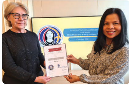
“ภาพจากการฝึกอบรมการทำธุรกิจขนาดไทยอย่างมีจรรยาบรรณ รุ่นที่ ๒”