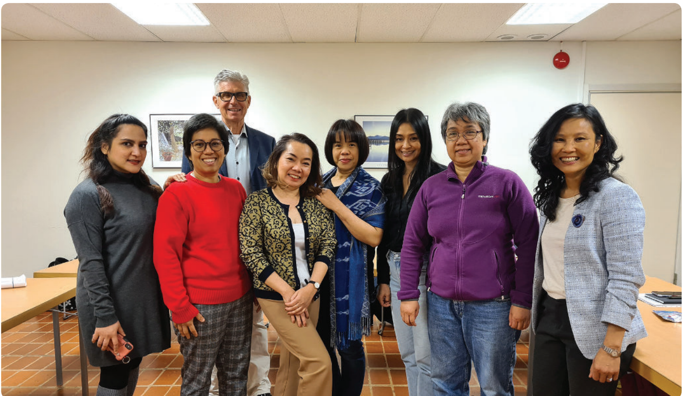
“ภาพจากการฝึกอบรมการทำธุรกิจนวดไทยอย่างมีจรรยาบรรณ รุ่นที่ ๑”