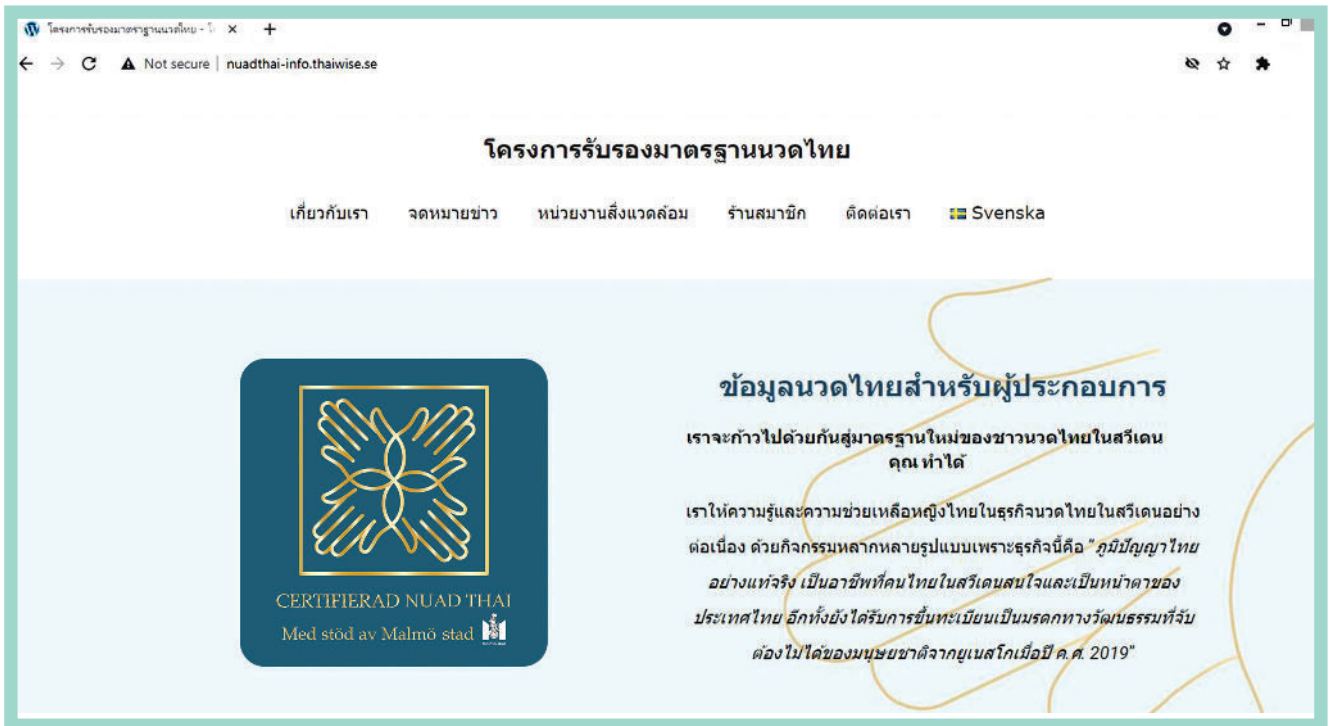
“เว็บไซต์นวดไทย โดยไทยไวส์”