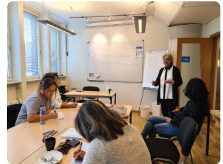
“ภาพจากการฝึกอบรมทำธุรกิจขนาดไทยอย่างมีจรรยาบรรณ ที่เมืองมัลเมอ”

จนถึงปัจจุบัน มีผู้เข้าร่วมโครงการในเมืองมัลเมอแล้วจำนวน 9 ร้าน ทุกคนผ่านการอบรมตามขั้นตอน และรู้สึกว่าได้รู้หลายเรื่องที่ไม่เคยรู้มาก่อน หรือเคยรู้แบบไม่ชัดเจน เมื่อผ่านการอบรมความชัดเจนเกิดขึ้น และสามารถนำไปปรับใช้กับกิจการของทางร้านได้เป็นอย่างดี โดยเฉพาะเรื่องเกี่ยวกับระบบการจ้างงาน และระบบภาษี รวมทั้งการเขียนแผนทางการเงินที่จะส่งผลให้ธุรกิจไปรอดได้ตลอดรอดฝั่ง และทุกคนยืนยันว่านี่คือโครงการที่ทำให้ตาสว่าง และจะบอกต่อเพื่อนคนไทยในธุรกิจขนาดไทยคนอื่นๆ ต่อไป