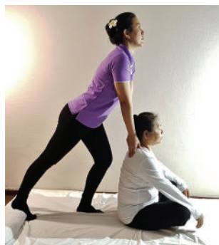
นวดแบบราชสำนัก

สายนวดแบบราชสำนัก เป็นการนวดถวายเจ้านายชั้นผู้ใหญ่ ผู้มีสถานบรรดาศักดิ์ที่อยู่ในรั้วในวัง การนวดจะใช้เฉพาะนิ้วมือและมือเท่านั้น และท่วงท่าที่ใช้ในการนวดมีความสวยงามเรียบร้อย จะกดนวดไปตามแนวเส้นและจุดสัญญาณตามส่วนต่างๆ ของร่างกาย ใช้ท่าทางและองค์ประกอบผู้นวดเพื่อกำหนดทิศทางและขนาดของแรงที่ใช้ในนวด ประโยชน์ในการกระตุ้นระบบการไหลเวียนเลือดและน้ำเหลือง และกระตุ้นระบบประสาทให้ทำงานดีขึ้น วัตถุประสงค์เพื่อบำบัดรักษาโรคและฟื้นฟูสุขภาพของผู้ป่วย