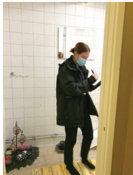
เจ้าหน้าที่ Miljöförvaltningen เทศบาลมัลเมอ ลงตรวจร้านนวด

สิ่งที่คุณต้องรู้คือเมื่อใดที่เจ้าหน้าที่จากหน่วยงานสิ่งแวดล้อมมาเยี่ยมร้านของคุณ โปรดทราบว่าทุกนาทีที่เจ้าหน้าที่ใช้เวลาตรวจตราร้านของคุณนั้น ร้านคุณจะต้องจ่ายค่าเสียเวลาของเจ้าหน้าที่ หากตรวจแล้วไม่พบว่ามีปัญหาใดๆ ค่าใช้จ่ายที่คุณต้องจ่ายก็เป็นจำนวนไม่มาก แต่หากตรวจพบปัญหา ทางเจ้าหน้าที่จะต้องกลับไปเขียนรายงาน และส่งให้เจ้าของร้านพิจารณาแก้ไขปัญหานั้น และเจ้าหน้าที่ก็จะกลับมาติดตามดูผลลัพธ์ ว่าคุณได้ปรับปรุงร้านของคุณตามคำแนะนำหรือไม่ ตรงนี้แหละเป็นเรื่องที่น่าหนักใจ เพราะคุณจะต้องจ่ายค่าเสียเวลาของเจ้าหน้าที่ ซึ่งเป็นจำนวนไม่