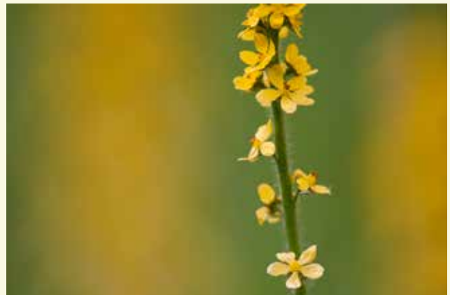
Gewone agrimonie ziet er verre van gewoon uit, met haar fijne, gele bloempjes op een lange steel. Kijk op de Vrije Dijk uit naar deze schoonheid.