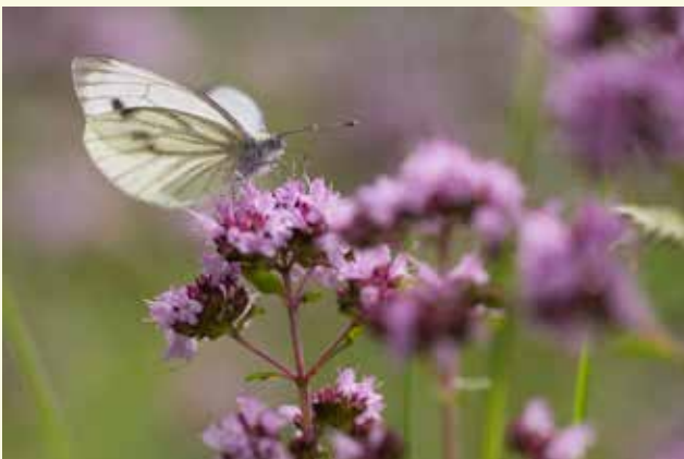
Een koolwitje laaft zich aan de bloemen van de geurige, wilde marjolein

En dat is geen dromerij van enkele groene jongens. Dat dit beheer zijn vruchten afwerpt, toonde een 1000 soortendag in 2021 aan. Toen vonden vrijwilligers van Natuurpunt