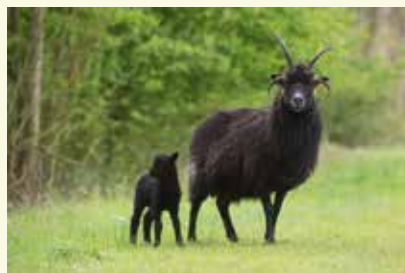
Hebrideans redden zichzelf: hebben geen drinkwater of extra voeding nodig

Elke laatste zondag van mei kan je in Assenede kennismaken met deze Hebrideans, tijdens de Schapendag van Natuurpunt Meetjeslandse Kreken. De schapen worden geschoren, er zijn demo's rond het verwerken van de wol en er is een bar. Alle info op www.natuurpunt.be/meetjeslandsekreken .