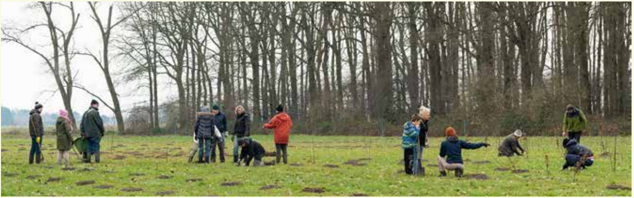
Boomplantactie aan het Meuleken in Boekhoute moest deels worden overgedaan