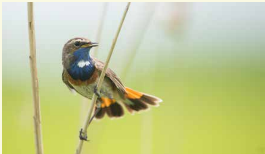
De blauwborst broedt in de dichte begroeiing van de Doornendijk

Natuurpunt kocht in 2021 een stuk van de Doornendijk aan. Het andere stuk van de dijk, waar Verzeles Put ligt, is in privéhanden. Elke inwoner van Assenede kent de Doornendijk: totdat jaren geleden het privéstuk voor het grote publiek werd afgesloten, was dit een geliefkoosde plek voor een familiale zondagswandeling.