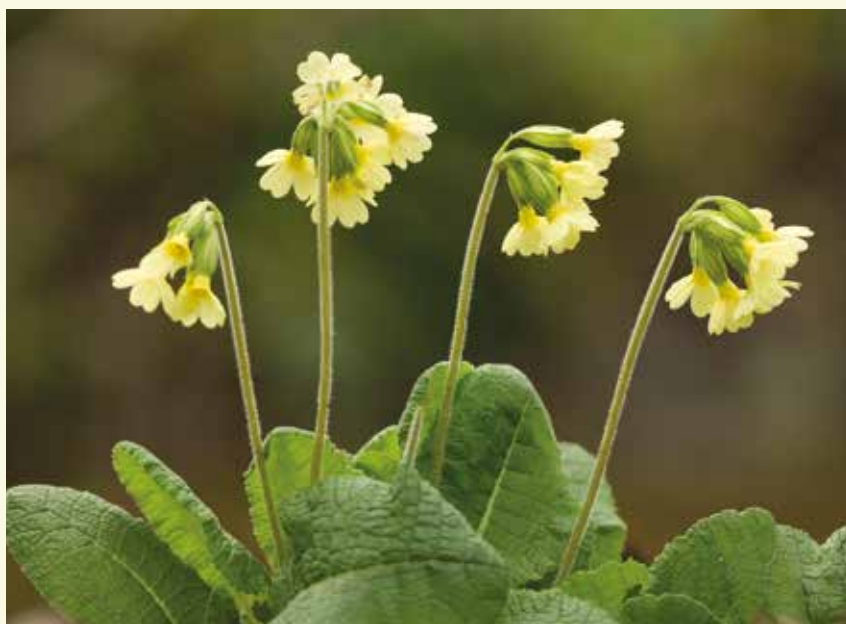
De slanke sleutelbloem vind je in het voorjaar onder meer in Het Leen, het Kattenbos en Burkel

Eenmaal de Gravin d'Alcantralaan overgestoken, zie je links en rechts hoe in de jaren 1970 een belangrijk deel van de Lembeekse Bossen werd verkaveld tot bouwgrond, met een grote villawijk tot gevolg. Een lot dat vele bosgebieden in Vlaanderen in die tijd was toebedeeld. Ook de uitgebreide horecafaciliteiten aan de Heihoek zijn een typisch voorbeeld van Vlaams toerisme. Hier dwars je de Lembeekse Bossen, met uitlopers tot de Oosteeklose Bossen, die grotendeels op de dekzandrug Maldegem-Stekene liggen. De aangeplante naaldbomen deden vroeger dienst als steunbalken in de mijnbouw. Het hout begon immers te kraken op het moment dat een mijnengang dreigde in te storten, een signaal voor de mijnwerkers om de mijnengang te verlaten. Nu worden die naaldbossen stelselmatig vervangen door gemengd loofbos.