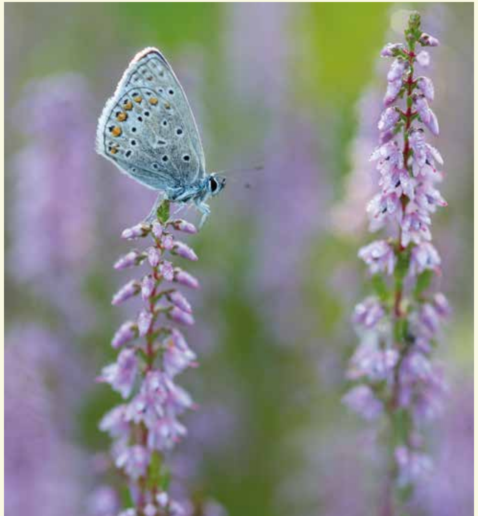
Icarusblauwtje op struikheide, een typisch beeld voor het Maldegemveld of het Heidebos

De laatste jaren heeft ANB (Agentschap voor Natuur en Bos) in het Drongengoed grote werken uitgevoerd om het naaldhout, dat in veel gevallen al aangetast was door de schorskever, om te vormen naar heide. Eens je in het open veld komt, rij je dwars door