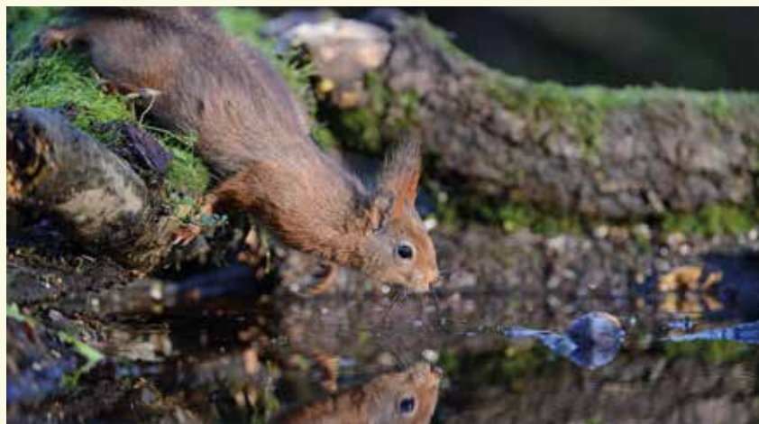
De Europese rode eekhoorn is goed ingeburgerd in onze Meetjeslandse bossen

Bewegwijzering: gebruik het kaartje of de gps-tracks op www.npmeetjesland.be/ fietsenwandel