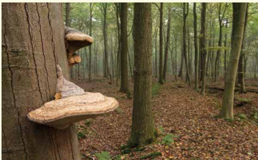
Het Bellebargiebos, gekend voor zijn zwammen