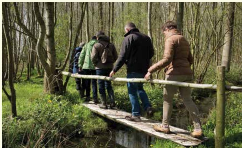
Het Kattenbos, een avontuur voor groot en klein

Merk het grote verschil met de naaldbossen van het Keigat. Dit lager gelegen moerasbosje is vooral gekend vanwege zijn voorjaarsbloeiers zoals dotterbloem, bosanemoon en sleutelbloem. Stap er gerust even binnen en hop van het ene naar het andere brugje. De korte wandelroute door dit bijzonder bosje duurt nog geen half uurtje. Werp achteraan in het bos door de bomen ook een blik op het open veld, het Zegbroek. Daar plaatste Natuurpunt Maldegem-Knesselare een nestpaal voor ooievaars, voorlopig zonder succes.