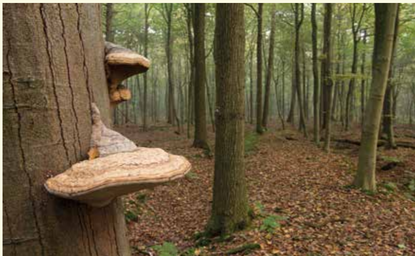
Het Bellebargiebos, gekend voor zijn zwammen