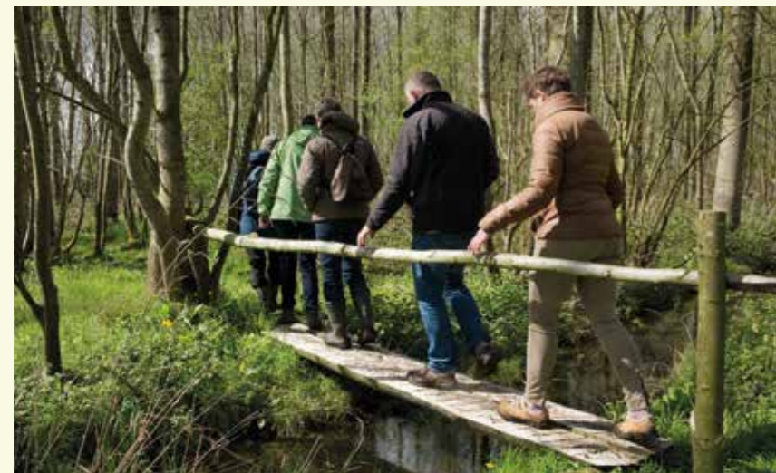
Het Kattenbos, een avontuur voor groot en klein