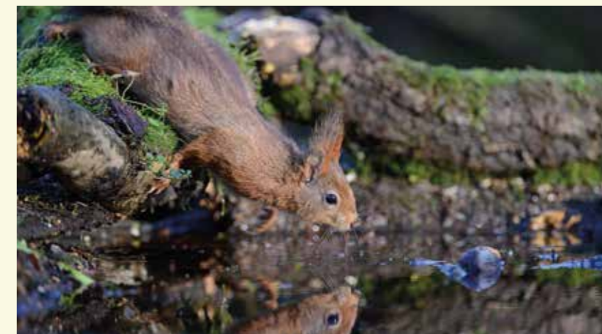
De Europese rode eekhoorn is goed ingeburgerd in onze Meetjeslandse bossen

Bewegwijzering: gebruik het kaartje of de gps-tracks op www.npmeetjesland.be/ fietsenwandel