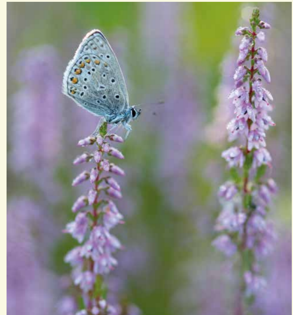
Icarusboutwtje op struikheide, een typisch beeld voor het Maldegemveld of het Heidebos

De laatste jaren heeft ANB (Agentschap voor Natuur en Bos) in het Drongengoed grote werken uitgevoerd om het naaldhout, dat in veel gevallen al aangetast was door de schorskever, om te vormen naar heide. Eens je in het open veld komt, rij je dwars door