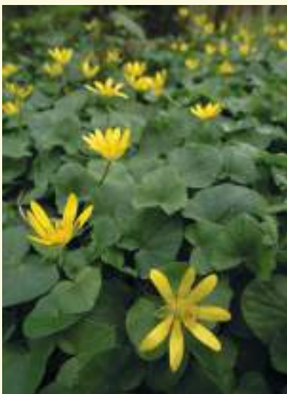
Eén van de eerste bloeiers is speenkruid

Of je ziet links een buizerd of een schuwe ree aan de rand van het Kallekesbos. Wat verderop links plantte Natuurpunt in de winter van 2020 2,5 hectare gemengd bos aan.