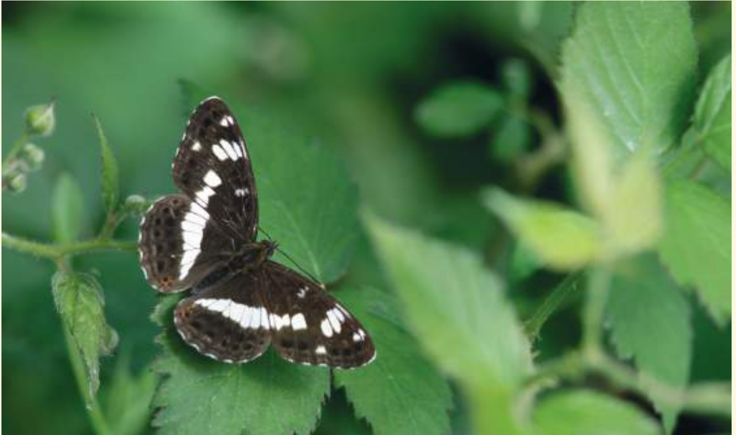
De kleine ijsvogelvlinder, typisch voor vochtige bosranden