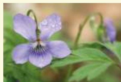
Zoek het bosviooltje dicht bij de grond

Rechts in de beek vind je tientallen meters winterpostelein, links staan wat typische planten als valse salie en brem. Met wat geluk tref je er een bijzondere vlinder aan onder de mooie zomereiken: de eikenpage is vooral tegen de avond van een warme zomerdag te zien.