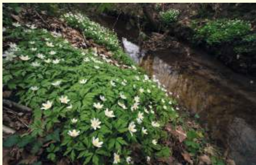
Voorjaarsbloeiers langs de Splenterbeek, een typisch beeld in Burkel