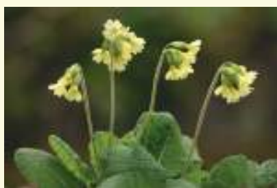
De slanke sleutelbloem is samen met de stengelloze sleutelbloem het 'gele goud' onder de voorjaarsbloeiers

Deze grindweg vormt de grens tussen Oedelem (links) en Maldegem (rechts), dus ook tussen West- en Oost-Vlaanderen. Links ligt het Koningsbos, rechts voor duikt het Kallekesbos tussen de populierendreven op.