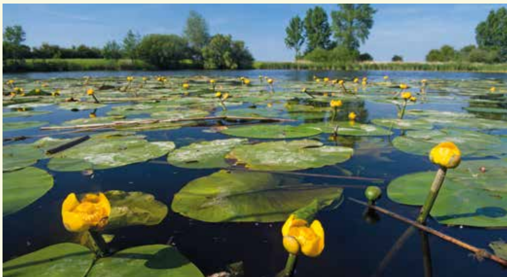
Gele plomp is sinds het herstel van de Vrouwkeshoekkreek een vaste waarde in het kreekwater

had het de aanblik van bijvoorbeeld het Verdrongen Land van Saeftinghe of Het Zwin, waar de getijden voelbaar waren. In de dertiende eeuw werd het gebied omgezet naar cultuurland. Dorpjes en gehuchten ontstonden. In 1375 echter zorgde een hevige storm voor overstromingen, waardoor heel wat dorpen van de kaart werden geveegd. Roeselare of Nieuw-Roeselare, een stadje in de buurt waar nu de Roeselarekreek ligt, is één van de bekendste voorbeelden.