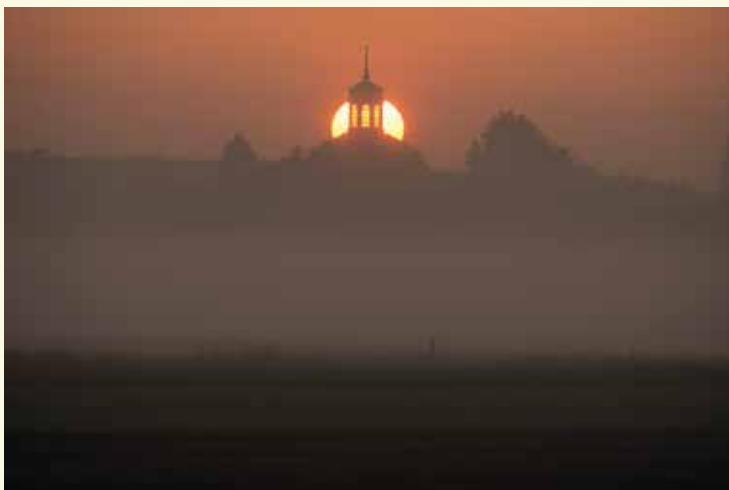
De toren van het Godshuis, zichtbaar van in de polders

Op dit begraasd stuk loop je op de bedding van de Eeklose Watergang. Die lag er al voor het kanaal gegraven is: van in de dertiende eeuw. Gravin Johanna van Constantinopel verkocht toen op grote schaal veengronden uit het Moer (moeras) van Aardenburg, waartoe ook Sint-Laureins behoorde, om de ontginning van het gebied te stimuleren.