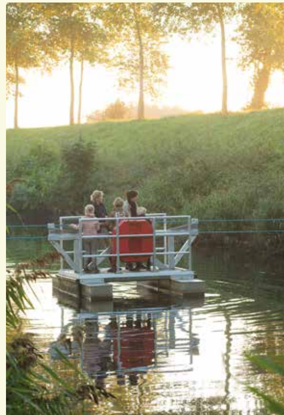
Met het voetveer geraak je het Leopoldkanaal over, een leuke ervaring voor jong en oud

Elke grenspaal heeft een uniek nummer. Grenspaal nummer 1 staat op het Drielandenpunt in Vaals, de laatste met nummer 365 staat in het Zwin ten westen van Retranchement. De kegelvormige ijzeren palen wegen 372 kg en zijn geplaatst in een cementen voetstuk van 70 centimeter. (bron: https://inventaris.onroerendergoed.be/themas/139 )