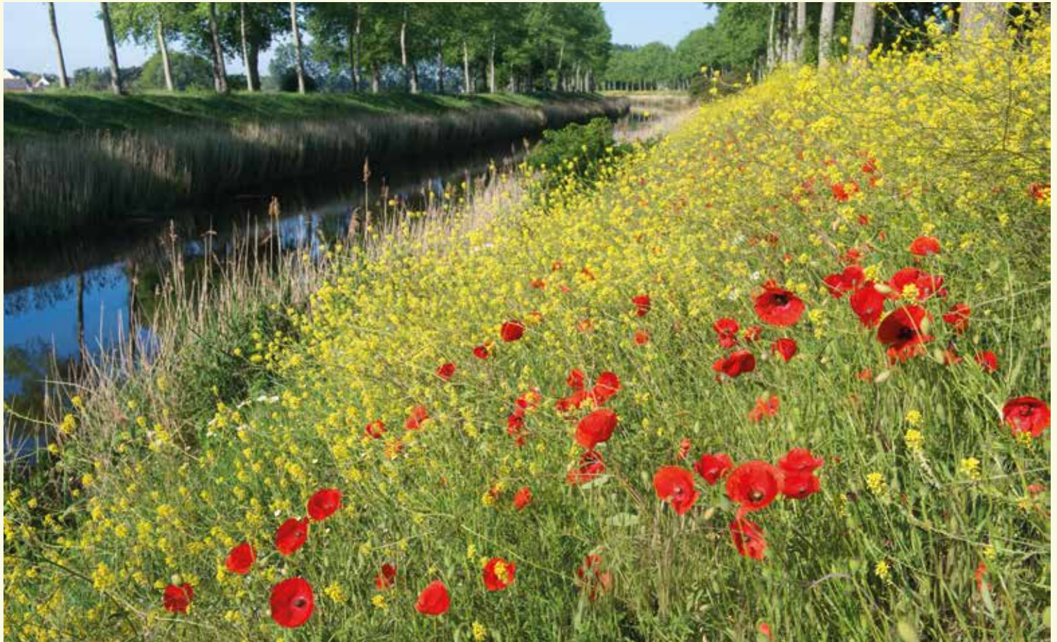
Bloemrijke berm langs het Leopoldkanaal

De Eeklose Watergang naar Aardenburg ontstond in het kader van turftransport. Turf is gedroogd veen dat werd gewonnen uit de toenmalige moerassen in het Krekengebied. Het werd gebruikt als brandstof. De gedroogde turfplakken werden met platschuiten naar steden als Aardenburg, Gent en Brugge gebracht. Rond 1300 was heel het Moer ontveend en omgezet in akker, weiland en hooiland. De ontwikkeling van dorpen in het gebied kon beginnen. De kanaaltjes droegen door hun drainerende functie overigens ook bij tot het afwateren en droogleggen van de polders. Namen zoals de Moerstraat verwijzen nog naar de tijden van de veenontginning.