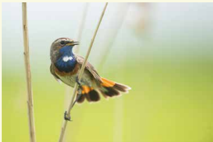
De blauwborst broedt graag op plekken met brede rietkragen

Hier kom je aan de grens met Nederland. Zie je de grenspaal? De wit geschilderde, gietijzeren palen zijn voorzien van de zwart geschilderde wapenschilden van België en Nederland in reliëf. Ze dateren uit 1843: nadat België zich in 1830 onafhankelijk had verklaard, ging in 1843 een verdrag in voege, waarin het grensverloop werd beschreven en vastgelegd.