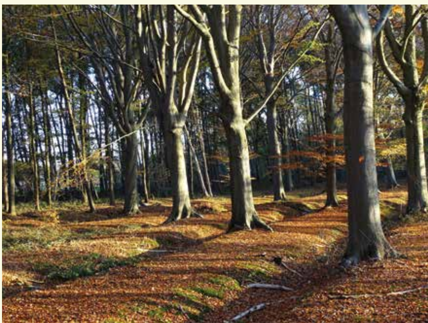
In het Pastershuyzekensbos zie je duidelijk de rabatten

Om je wandeling te starten, ga je op zoek naar de Natuurpunt-wegwijzers.