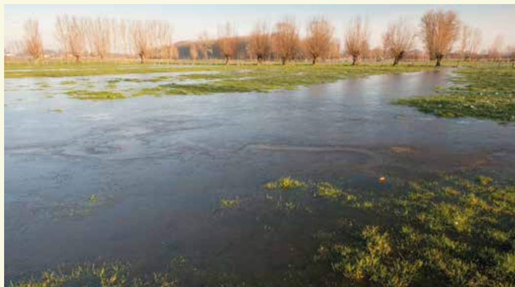
Vossenholse Meersen

De onverharde dreef loopt uit op de Grote Nieuwhofdreef die je links neemt. De naam van deze straat is genoemd naar het Nieuwhof dat je rechts voor je kan bewonderen 7 . Het Nieuwhof dateert uit de tweede helft van de 18de eeuw en