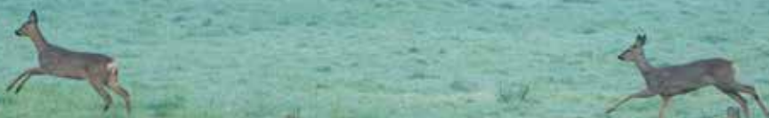
Reeën Drongengoed

Natuurpunt koopt en herstelt natuur, zodat iedereen ervan kan genieten. We maken van kleine, versnipperde bosjes zoals in dit wandelgebied één groot natuurgebied. Dat kan alleen dankzij jouw steun. Je ontvangt een fiscaal attest voor giften vanaf 40 euro, waarmee je ongeveer 30% van het gestorte bedrag terugkrijgt via je belastingen. Doe je gift op rekeningnummer BE56 2930 2120 7588 van Natuurpunt, Coxiestraat 11, 2800 Mechelen. Vergeet niet te vermelden 'gift projectnr. 6639 Torrebos'.