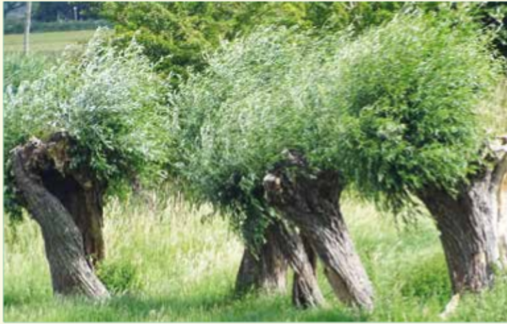
Wilgen aan Stenenschuur