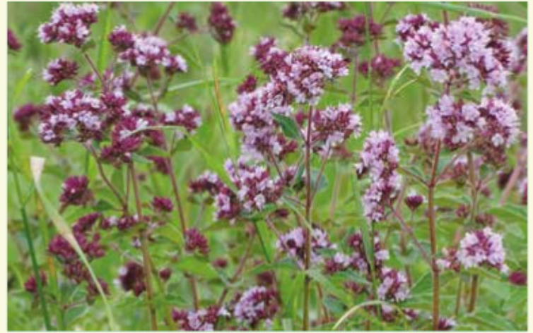
De vroeger alomtegenwoordige wilde marjolein vind je tegenwoordig nog bijna uitsluitend op de dijken in beheer van Natuurpunt

Voorbij 51 fiets je op de Doornendijk. Links passeer je de Doornendijk en rechts de Grote Geul. Ooit broedden hier de Cetti's zanger, het woudaapje, de ransuil, zelfs de rode wouw. Waar deze aansluit op de Hollekensdijk kijk je op de grotendeels dichtgeslibde Vlietgeul, ooit de havengeul naar Assenede, waar de huidige krekens slechts zijarmen van waren. In deze geul heeft Natuurpunt met steun van de gemeente Assenede al een eerste reeks percelen kunnen verwerven. Het is de bedoeling hier opnieuw een aaneengesloten natuurgebied van te maken.