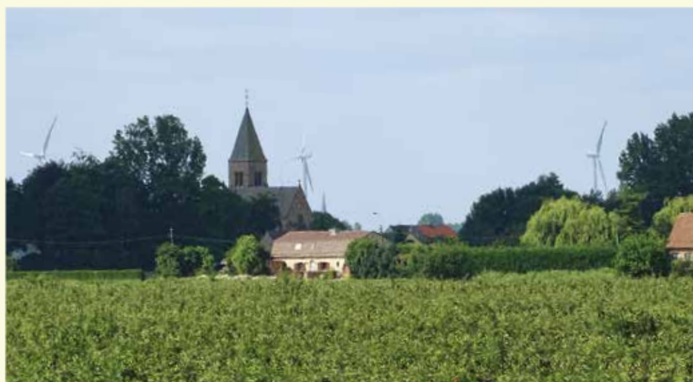
De kerk van Landsdijk

Aan 55 steek je de drukke Stationsstraat in Boekhoute over en zie je aan je rechterkant het oude stationnetje van Boekhoute. Aan 61 kan je even stoppen om het pittoreske dorpscentrum van Bassevelde te bewonderen, met een oude laan van wilde kastanjes of paardenkastanjes. Deze naam zou ontstaan zijn omdat de knoppen van de paardenkastanje littekens nalaten die op paardenhoeven lijken. De paardenkastanjes hebben het in onze streken zwaar te verduren door aantast van de kastanjemineermot en van de bloedingsziekte veroorzaakt door een parasiet. Eén van de kastanjes moest vorig jaar dan ook sneuvelen.