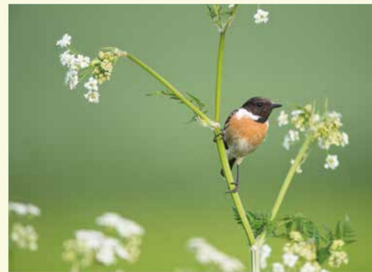
Kijk op je tocht uit naar de roodborsttapuit