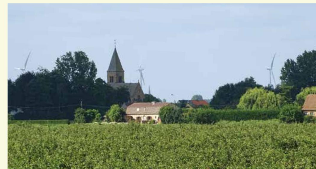
De kerk van Landsdijk

Je vindt de gps-tracks van deze route ook op www.NPMeetjesland.be/strekdebeneen .