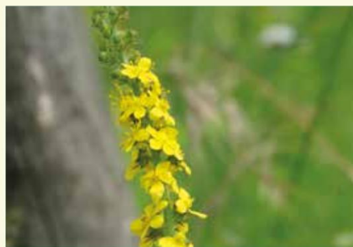
Aardaker heeft prachtige lila bloemen, agrimonie is dan weer felgeel