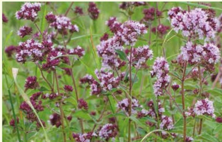
De vroeger alomtegenwoordige wilde marjolein vind je tegenwoordig nog bijna uitsluitend op de dijken in beheer van Natuurpunt