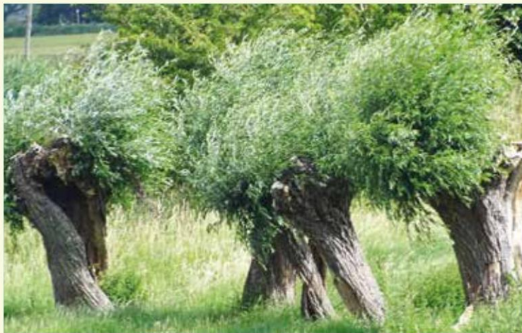
Wilgen aan Stenenschuur