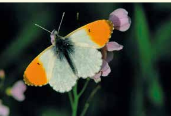
Oranjetipje op pinksterbloem

De enige bemesting is afkomstig van de periodieke overstromingen en de uitwerpselen van de grazers. Tijdens de maand april zien deze hooiweiden paarswit van de pinksterbloemen. Ook de echte koekoeksbloem heeft haar plekje teruggevonden en allerlei insecten vinden er een eldorado. Het oranjetipje, een prachtig vlindertje dat zijn eitjes aflegt op pinksterbloem of look zonder look, zal je hier in het voorjaar heel talrijk aantreffen.