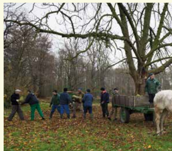
Bosbeheer met paarden

Je stapt verder in de dreef en komt in een van de oudste bosbestanden 8 . Hier werd eeuwenlang een strak hakhoutbeheer toegepast. Om de acht jaar werden de hakhoutstoven gekapt. Het kleinhout werd in 'bossen' of 'facelen' gebonden om de bakoven te stoken. De grachten werden gereinigd, klimplanten verwijderd en alle dood hout opgeruimd. Resultaat was een weelderige voorjaarsflora, bestaande uit slanke sleutelbloem, speenkruid, klaverzuuring, gele dovenetel en bosanemoontjes. Dankzij een degelijk beheerplan wordt dit hakhoutbeheer weer uitgevoerd: een samenwerking tussen de gemeentelijke groendienst en vrijwilligers, die het hout gratis mogen meenemen.