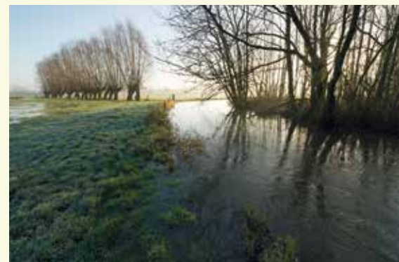
Poekebeek buiten oevers

Bij hevige regenval treedt de Poekebeek heel snel buiten haar oevers. Vooral tijdens de winter hoor je er dan het typische geluid van de wintertaling, een eendensoort. Vroeger bleef dit water tijdens de winter heel lang op de meersen staan. In Poeke schatte men in 1941 de periodiek overstromde oppervlakte op 27 hectare. Aan de linkerkant kocht Natuurpunt Aalter een grasland 10 aan. Er werd een drinkpoel gegraven, een houtwal aangeplant en langs de beek verschenen opnieuw populieren. In samenwerking met een lokale landbouwer werd ook hier een hooiweidebeheer opgestart. Ook de beekdalbosjes voor je werden aangekocht. Hier werd geopteerd om een nulbeheer uit te voeren. De bosjes vormen een schuilplaats voor de vos, reeën en kleine zoogdieren. Tijdens de lente hoor je er de bosrietzanger, zwartkop en tuinfluiter. Hopelijk voelt de nachtegaal zich ooit aangetrokken om hier opnieuw te broeden. Wielewaal, fluiter en nachtegaal waren trouwens tot in de jaren '90 van vorige eeuw regelmatig broedvogels in het park.