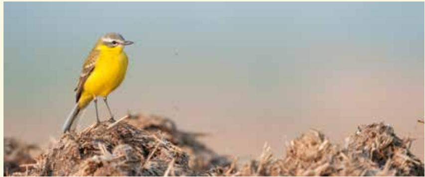
Grote gele kwik

Nu kom je opnieuw in de verbindingdreef. Je stapt naar links. Je komt langs twee majestueuze eiken, overlevenden uit het oorspronkelijke park, aangelegd in de 18de eeuw. Je kruist opnieuw de Poekebeek 15 . Hier heb je kans om een ijsvogeltje of de grote gele kwik te zien. Die laatste is een regelmatige broedvogel in het park.