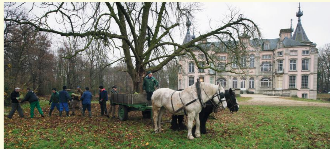
Bosbeheer met paarden

Je stapt verder in de dreef en komt in een van de oudste bosbestanden 8. Hier werd eeuwenlang een strak hakhoutbeheer toegepast. Om de acht jaar werden de hakhoutstoven gekapt. Het kleinhout werd in 'bossen' of 'facelen' gebonden om de bakoven te stoken. De grachten werden gereinigd, klimplanten verwijderd en alle dood hout opgeruimd. Resultaat was een weelderige voorjaarsflora, bestaande uit slanke sleutelbloem, speenkruid, klaverzuring, gele dovenetel en bosanemoontjes. Dankzij een degelijk beheerplan wordt dit hakhoutbeheer weer uitgevoerd: een samenwerking tussen de gemeentelijke groendienst en vrijwilligers, die het hout gratis mogen meenemen.