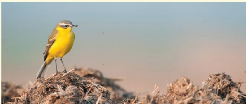
Grote gele kwik

Nu kom je opnieuw in de verbindingsdreef. Je stapt naar links. Je komt langs twee majestueuze eiken, overlevenden uit het oorspronkelijke park, aangelegd in de 18de eeuw. Je kruist opnieuw de Poekebeek 15. Hier heb je kans om een ijsvogeltje of de grote gele kwik te zien. Die laatste is een regelmatige broedvogel in het park.