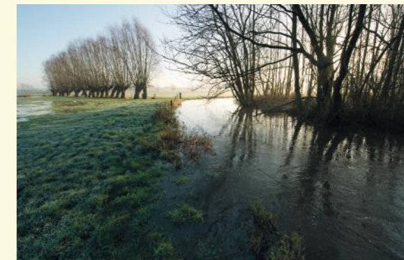
Poekebeek buiten oevers

Bij hevige regenval treedt de Poekebeek heel snel buiten haar oevers. Vooral tijdens de winter hoor je er dan het typische geluid van de wintertaling, een eendensoor. Vroeger bleef dit water tijdens de winter heel lang op de meersen staan. In Poeke schatte men in 1941 de periodiek overstroomde oppervlakte op 27 hectare. Aan de linkerkant kocht Natuurpunt Aalter een grasland 10 aan. Er werd een drinkpoel gegraven, een houtwal aangeplant en langs de beek verschenen opnieuw populieren. In samenwerking met een lokale landbouwer werd ook hier een hooiweidebeheer opgestart. Ook de beekdalbosjes voor je werden aangekocht. Hier werd geopteerd om een nulbeheer uit te voeren. De bosjes vormen een schuilplaats voor de vos, reeën en kleine zoogdieren. Tijdens de lente hoor je er de bosrietzanger, zwartkop en tuinfluiter. Hopelijk voelt de nachtegaal zich ooit aangetrokken om hier opnieuw te broeden. Wielewaal, fluiter en nachtegaal waren trouwens tot in de jaren '90 van vorige eeuw regelmatig broedvogels in het park.