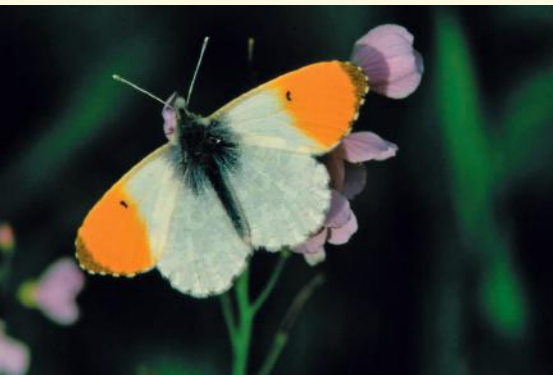
Oranjetipje op pinksterbloem

De enige bemesting is afkomstig van de periodieke overstromingen en de uitwerpselen van de grazers. Tijdens de maand april zien deze hooiweiden paarswit van de pinksterbloemen. Ook de echte koekoeksbloem heeft haar plekje teruggevonden en allerlei insecten vinden er een eldorado. Het oranjetipje, een prachtig vlindertje dat zijn eitjes aflegt op pinksterbloem of look zonder look, zal je hier in het voorjaar heel talrijk aantreffen.