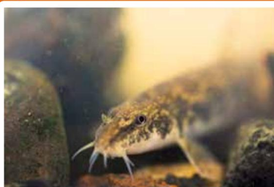
Het berrmpje, een weinig gekend visje, leeft in de Driesbeek

Steek de drukke Urselseweg over en fiets door het Drongengoedbos (750 hectare). Langs de Drongengoedweg, aan het wandelknooppunt 6, dwars je de Driesbeek. Ze ontspringt op het militair domein en mondt uit in het kanaal in Aalter als de Gottebeek. Het beekje is voor de regio ecologisch zeer waardevol. Er zwemmen nog minder algemene vissoorten zoals stekelbaarsjes en berrmpjes in dit beekje.