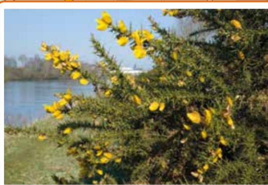
Gaspeldoorn, een typische plant voor de kanaalbermen