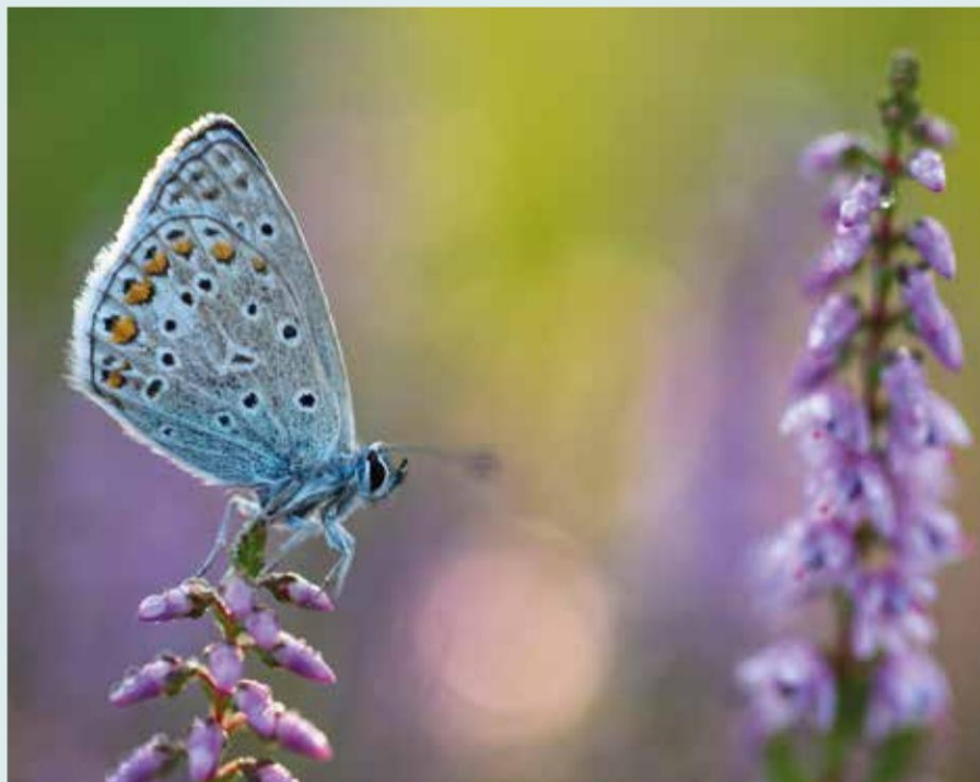
Een blauwtje op struikheide, wat een prachtige kleurencombinatie. De heide bloeit in augustus-september

Nabij X heb je een mooi zicht op het volkscafé Den Overzet aan de overkant van het kanaal. Dit café is zowat het centrum van de wijk Oostmolen. De wijk ontstond als nederzetting langs het kanaal, in de periode dat het kanaal vrijwel de enige economisch belangrijke transportweg was tussen Gent en Brugge. Dergelijke nederzettingen bestonden uit herbergen, handelshuizen, smidsen en rustplaatsen voor de trekpaarden.