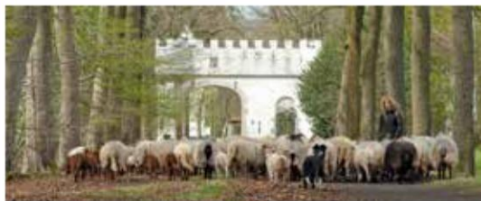
Met een beetje geluk ontmoet je de herderin met haar schapen