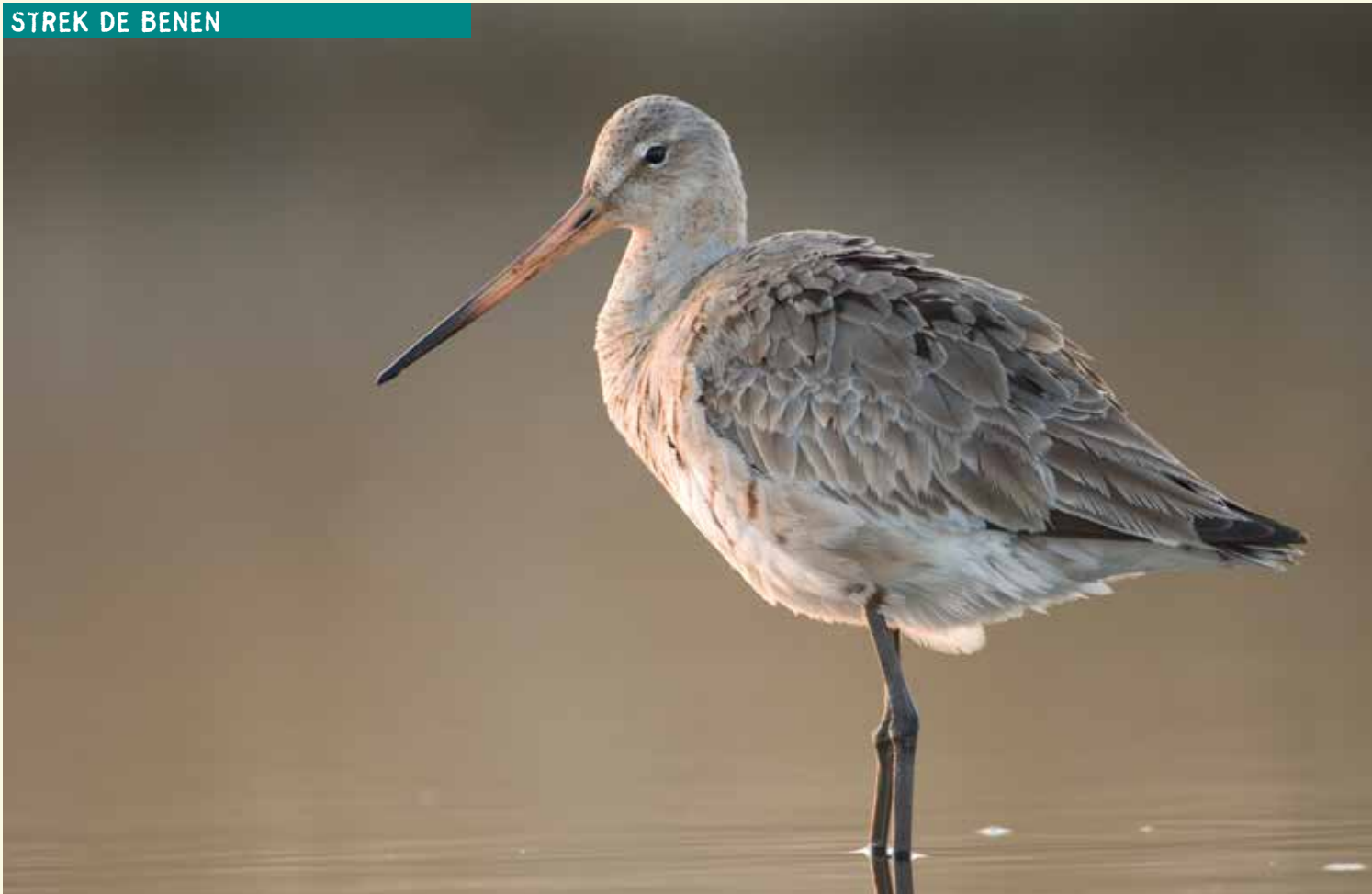
Ga tijdens je wandeling op zoek naar de grutto en andere weidevogels