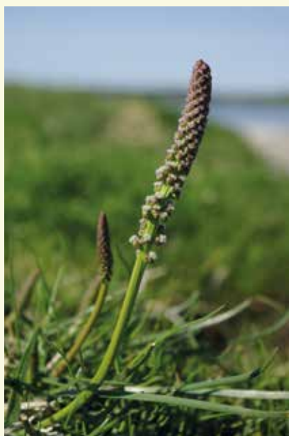
Schorrezoutgras vind je in de Geuzeput

Ga vanaf de kerk terug naar de Sint-Margrietestraat en stap noordwaarts richting knooppunt 93 . In de buurt van waar nu Sint-Margriete ligt, vond je in de 17de eeuw nog Nieuw-Roeselare. Het werd tot tweemaal toe volledig overspoeld door de zee en werd