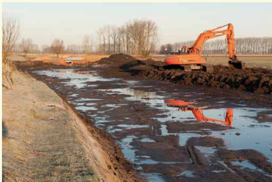
In 2012 werd de Vrouwkeshoekkreek opnieuw uitgegraven door Natuurpunt

Bij 97 aangekomen stap je naar 96 , waar je daarnet al in omgekeerde richting liep. Tussen 96 en 87 passeer je Wildekenslaagte, onder vogelaars ook wel de 'Gruttoweide' genoemd. Dit graslandcomplex is namelijk het bastion van de grutto in het Meetjeslands Krekengebied. Vanaf begin maart komen deze parmantige weidevogels aan uit hun zuiderse overwinteringsgebieden en beginnen meteen met het afbakenen van hun territorium.