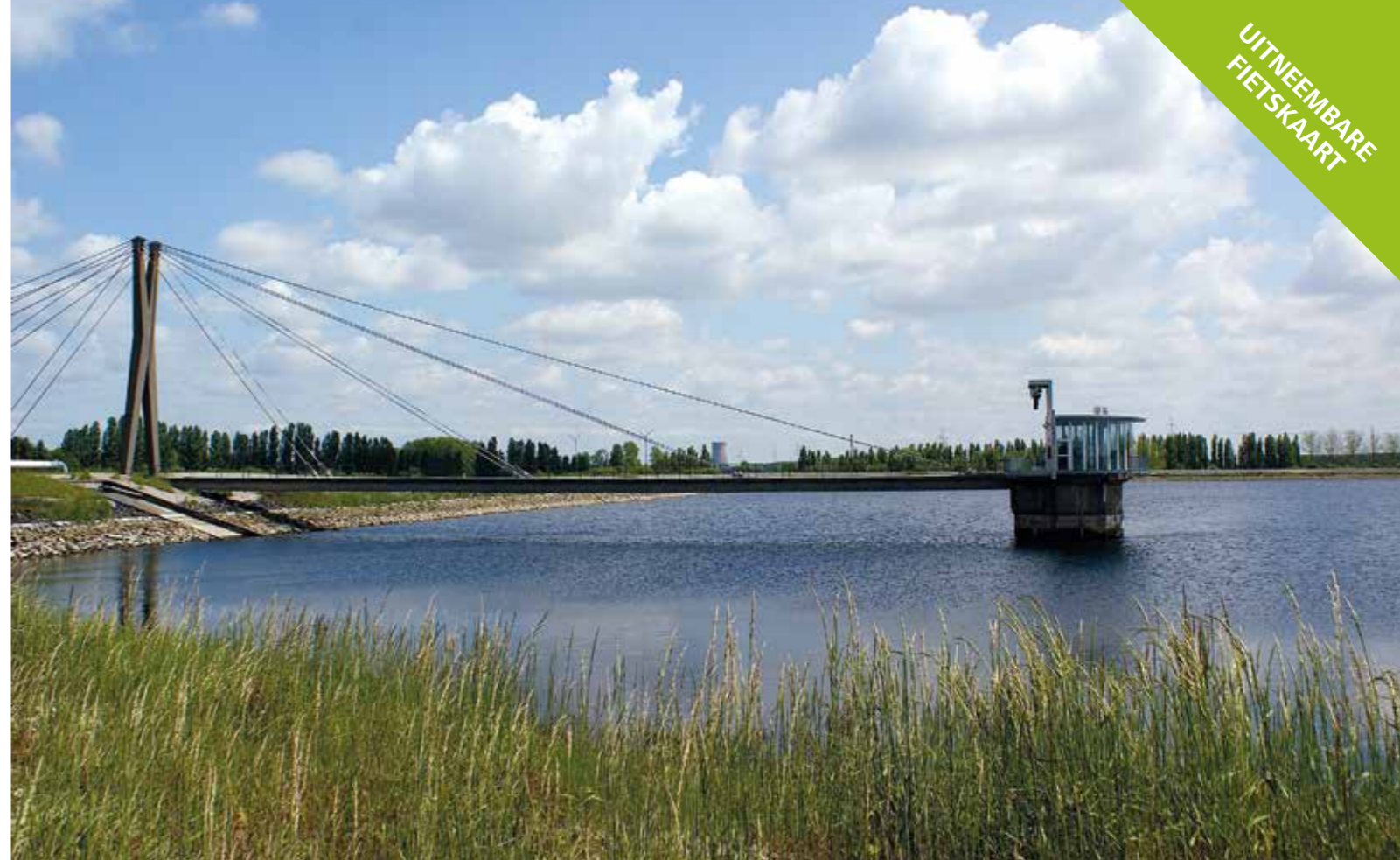
Spaarbekken van Kluizen