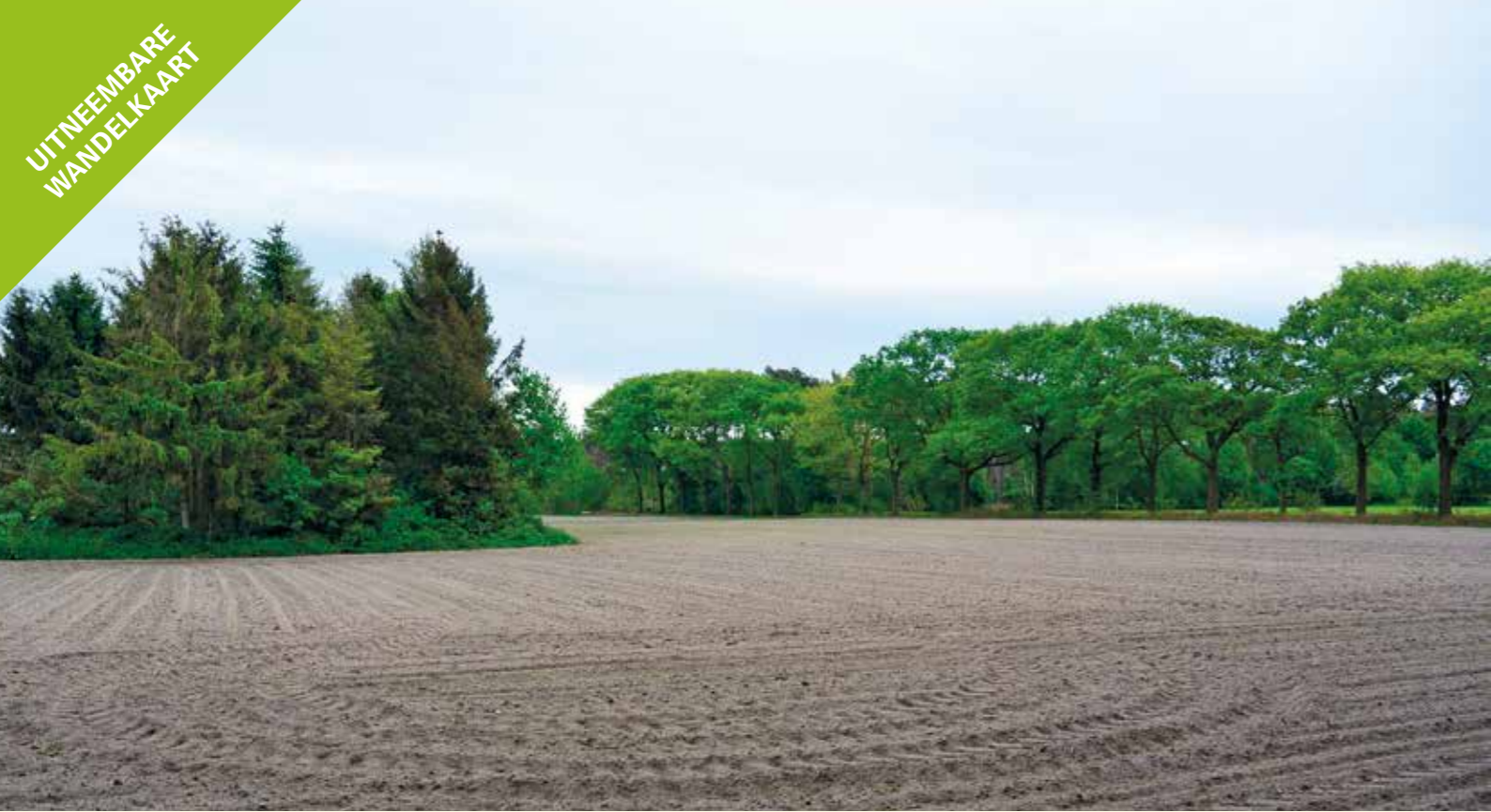
Het Scheutbos ligt tussen weilanden en akkers