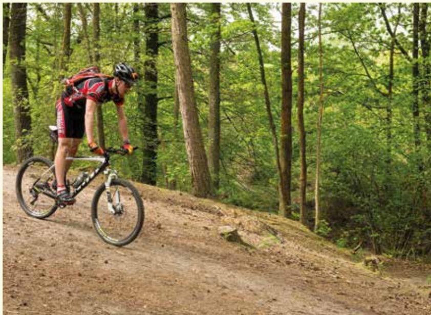
De Lembeekse Bossen zijn ook bij mountainbikers en ruiters erg geliefd