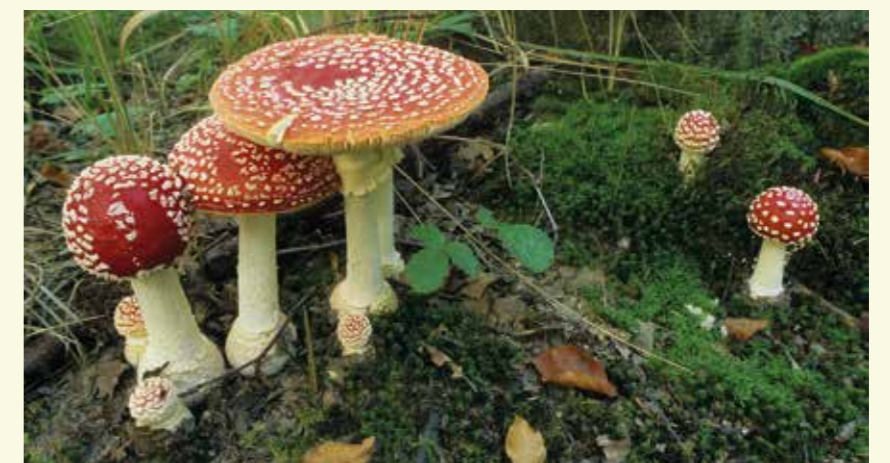
Het Bellebargiebos is gekend voor de paddenstoelen

GPS: 51°10'49.72"N 3°38'27.13"O De Tragelstraat is bereikbaar via de Eeklostraat en de Gravin d'Alcantaralaan.