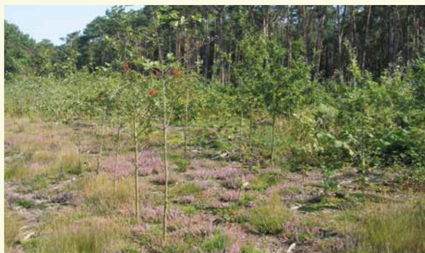
Het naaldhout wordt geleidelijk aan omgevormd naar loofhout, hier en daar komt struikhei tevoorschijn

Op sommige plaatsen in de Lembeekse Bossen vind je restanten van heide, die wijzen op de wastine die hier vroeger aanwezig was. Een wastine is een complex van grasland, heide, struweel en bos.