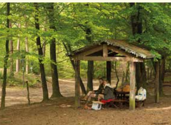
Het kaartershuisje

Aan 34 zie je het 'kaartershuizeke', een begrip voor de Lembeekse Bossen. Het is een rust- en ontmoetingsplek voor iedereen die hier komt. Heb je kinderen mee? Pik dan even het avonturenparcours in het speelbos mee. Het parcours start tegenover het kaartershuisje.