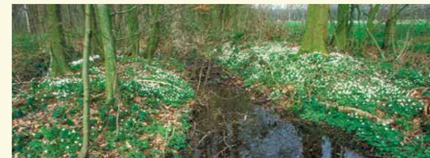
Bellebargiebos in het voorjaar: een tapijt van bosanemonen

het Agentschap voor Natuur en Bos. Het bos is prachtig in de herfst en is gekend omwille van de paddenstoelenrijkdom. In het voorjaar vind je er ook soorten zoals dalkruid, salomonszegel en bosanemoon.