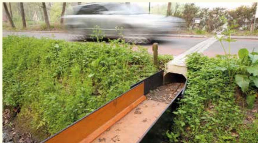
Amfibieëntunnel in de Lotenhullestraat

soorten echt te zien uitbreiden of voor zeldzamere soorten zoals waterlobelia.