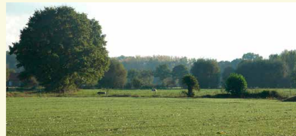
Een mooi stukje landschap vlakbij de Marktgebossen

4 Je ziet enkele tunneltjes onder de weg om padden tijdens hun trek na de winterslaap veilig naar deze vijver te leiden en omgekeerd. Aan je rechterkant