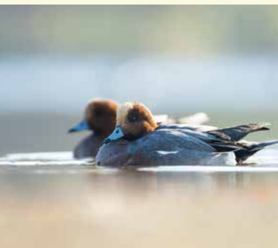
Je herkent de smient aan de korte, grijze snavel. De mannetjes hebben een rode kop met gelige vlek tussen de ogen. Men noemt ze ook wel 'fluiteend' omwille van hun 'pieuw' roep.

De brug over laat je twee straatjes (Bosvijverdreef en Kraenepoelpad) links liggen. Je bereikt al snel de Kraenepoel. Een goede mogelijkheid om van de Kraenepoel te genieten is het wandelpad links nemen (voorbij het klappoortje). Na een goeie 100 meter bereik je een kijkwand met zicht op de Kraenepoel. 3