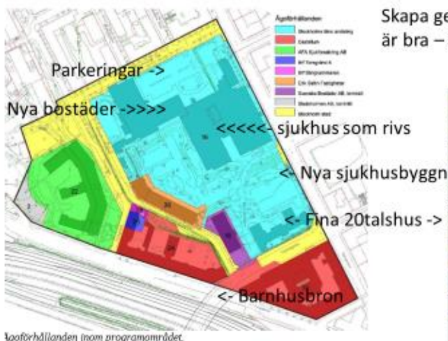
Kvarfördilanden inom programområdet.

River sjukhuset (norra delen av turkos yta) → 2 bostadskvarter där, arkitektur liknande 20-talshusen? Skulle ge harmoni med Vasastan.