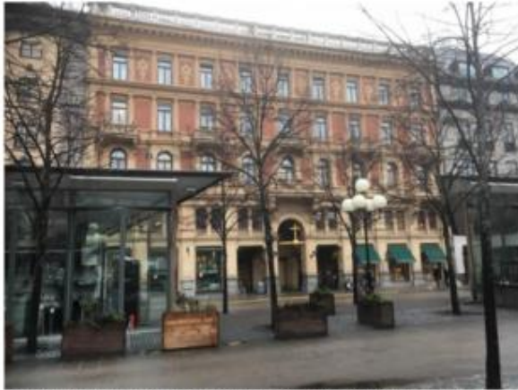
Gathuset sett från Kungsträdgården. Den avslutande genombrutna balustraden kröner byggnaden.

https://etjanster.stockholm.se/Byggochplantjansten/pagaende-planarbete/planarende/2018-14318