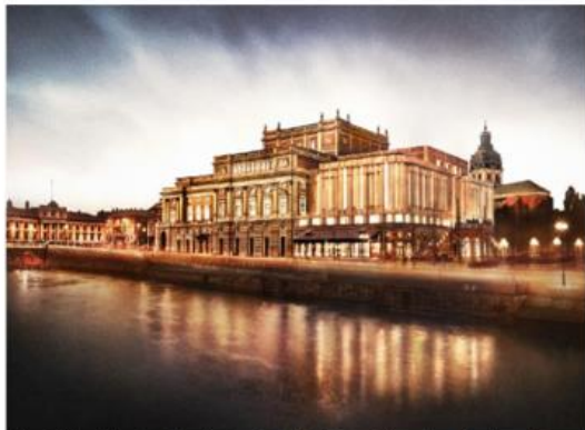
Visionsbilder i skymning från Slottskajen och Strömbron. Illustration: Lundgaard &

191222 Beslut att planförslag upprättas och prövas i plansamråd i enlighet med kontorets tjänsteutlåtande... Särskilt yttrande M, L, MP, C, KD ... det ska stå klart för Stockholmarna att samrådet är till för att alla som har intresse för det ska kunna delta i processen.