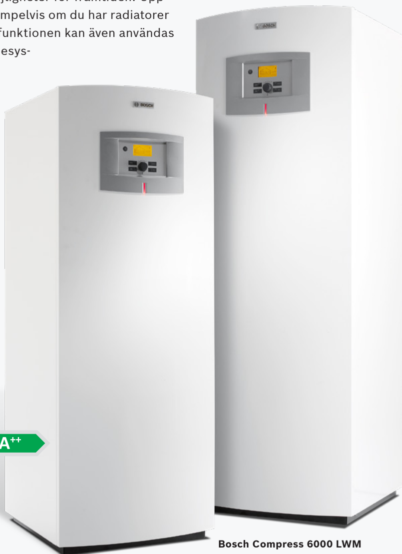
Bosch Compress 6000 LW