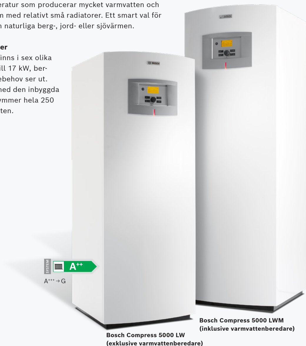
Bosch Compress 5000 LW (exklusive varmvattenberedare)

Compress 5000 LW/M finns i sex olika effektstorlekar, från 6 till 17 kW, beroende på hur ditt värmebehov ser ut. Den rostfria modellen med den inbyggda varmvattenberedaren rymmer hela 250 liter 40-gradigt varmvatten.