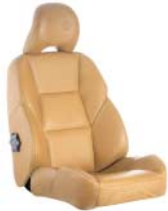
• Atacama luonnonnahka/ Atacama naturläder (S60: 9675, V70: A675)