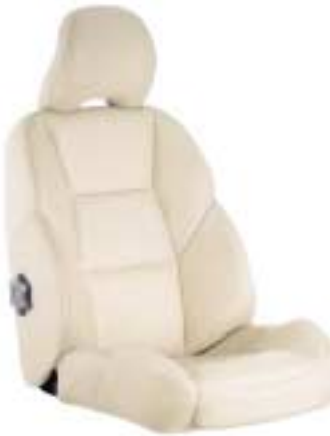
• Gobi softnahka beige/ Gobi softläder beige (S60: 9577, V70: A577)