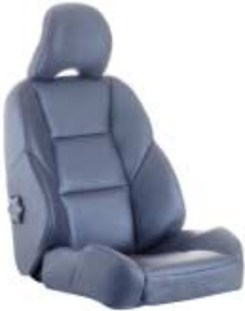
• Nordkap softnahka sininen/ Nordkap softläder blå (S60: 9576, V70: A576)