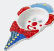
IJSCOUPE COUPE À GLACE

22,5 x 14,5 cm 4357400 Barcode/Code Ean 5400586121024