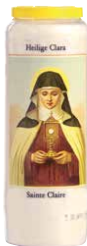
Heilige Clara ● 0745036.000