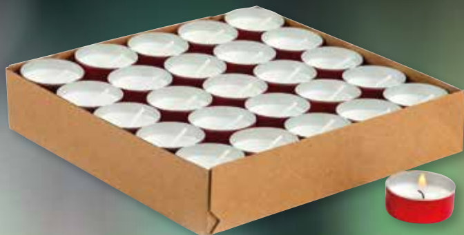
Devotielicht 2A rood 0816003.000