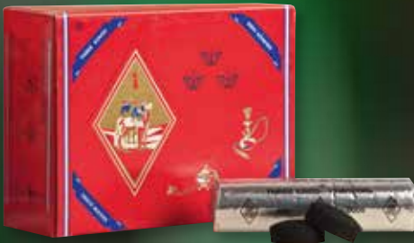
Houtskool diameter 33 mm doos x 100 stuks 1321000.000