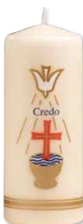
Doop 2 ● karton x 6 stuks 0060021.037