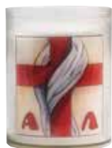
Paaswakekruisje R249 LINTEUM