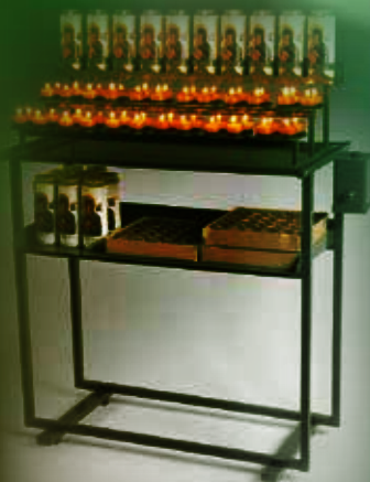
Grote offertafel combi 10 novenen + 48 devotielichten 1300013.000