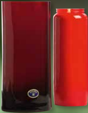
Cilindrisch godslampglas rood 1 stuk 1330001.013