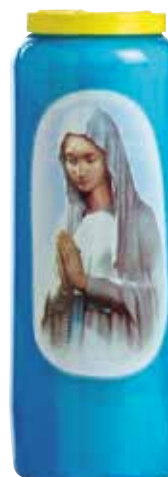
O.-L.-Vrouw Standaard blauw 0745007.000