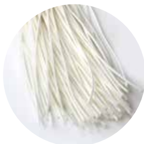
Wasstaafjes doosje x 70 stuks karton x 10 doosjes 2132002.000