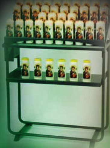
Grote offertafel 40 novenen 1300012.000