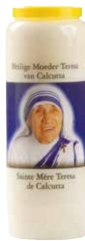
Heilige Moeder Teresa van Calcutta ● 0745066.000