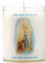
O.-L.-Vrouw van Lourdes karton x 60 stuks 0845016.000