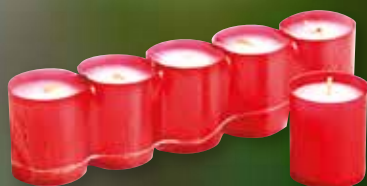
Devotielichten 24A rood verpakt per 5 0840001.000

Het brandt ongeveer 2 uur en biedt volgende voordelen : minder roetvorming, minder afval en een substantieel lagere prijs.