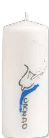
Doop 1 ● karton x 6 stuks 0060020.001