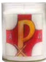
Paaswakekruisje R250 LABARUM 0845126.000