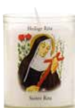
Heilige Rita karton x 60 stuks 0845017.000