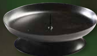
Kandelaar CVE 203 zwart karton x 10 stuks 1310038.018