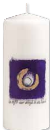
Uitvaart 1 ● karton x 6 stuks 0060015.001