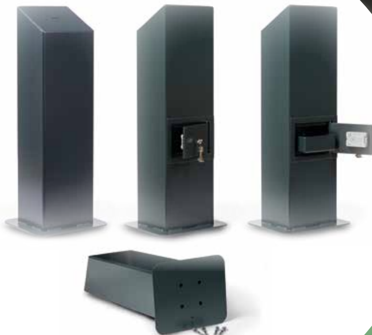
Offerzuil 250x200x900 mm inwerpgleuf bovenkant met anti-hengelbeveiliging 1300080.000 € 995,00 per stuk