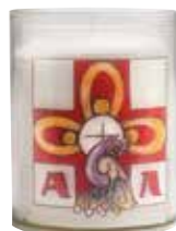
Paaswakekruisje R255 PAVO karton x 60 stuks 0845131.000