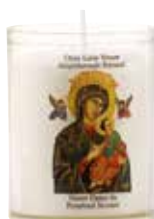
O.-L.-Vrouw van Altijddurende Bijstand karton x 60 stuks 0845015.000