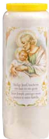
Heilige Jozef ● 0745021.000