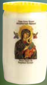
O.-L.-Vrouw van Altijddurende Bijstand karton x 20 stuks 0714008.000