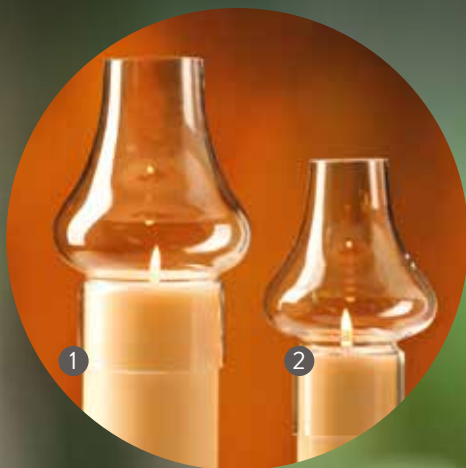
1 Windlichtglas voor duurzame mantelkaars 80 mm 1340036.000