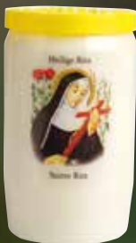
Heilige Rita karton x 20 stuks 0714019.000