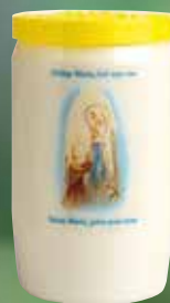
O.-L.-Vrouw van Lourdes karton x 20 stuks 0714012.000