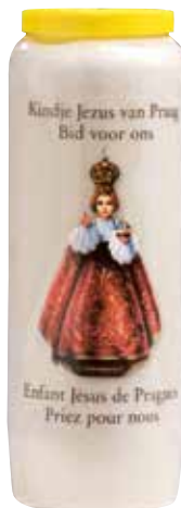
Kinjke Jezus van Praag 0745004.000