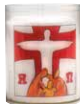
Paaswakekruisje R252 CRISTO REDENTOR 0845128.000