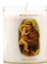
Heilige Antonius karton x 60 stuks 0845018.000