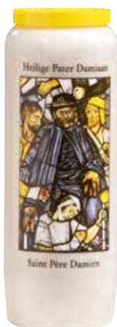
Heilige Pater Damiaan ● 0745023.000