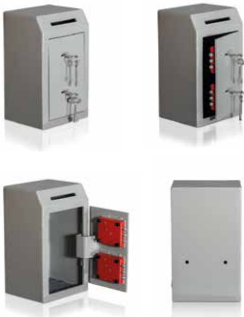
Offerblok 180x150x300 mm hoekinworp met 2 sloten 1300082.000 € 216,00 per stuk