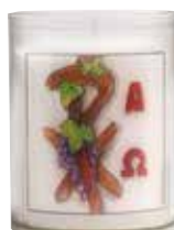
Paaswakekruisje R253 VITIS VINIFERA 0845129.000