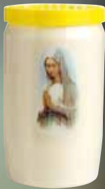
O.-L.-Vrouw Standaard karton x 20 stuks 0714006.000