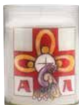
Paaswakekruisje R255 PAVO 0845131.000