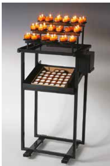
Kleine offertafel 36 devotielichten 1300031.000