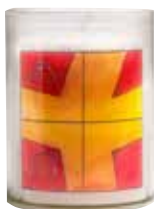
Paaswakekruisje R248 CRUX 0845124.000