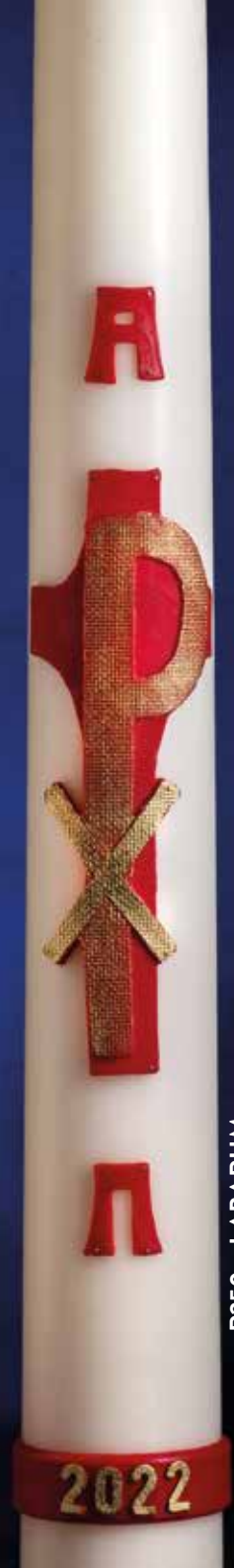
R250 - LABARUM