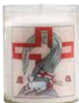
Paaswakekruisje R254 AGNUS DEI 0845130.000