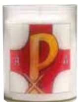
Paaswakekruisje R250 LABARUM