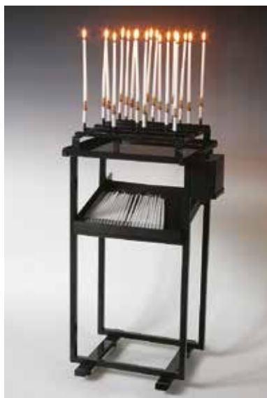
Kleine offertafel 18 offerkaarsen 1300030.000