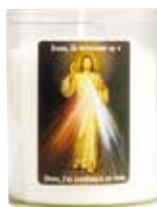
Jezus, ik vertrouw op u karton x 60 stuks 0845026.000