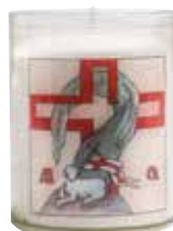
Paaswakekruisje R254 AGNUS DEI karton x 60 stuks 0845130.000