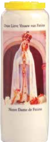
O.-L.-Vrouw van Fatima 0745013.000