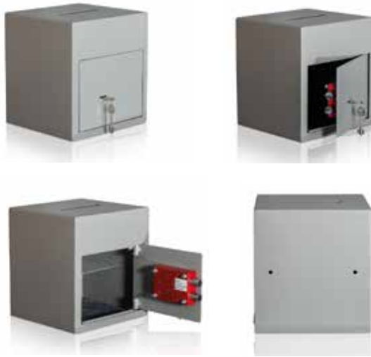
Offerblok 280x260x300 mm inwerpgleuf bovenkant met anti-hengelbeveiliging 1300083.000 € 324,00 per stuk