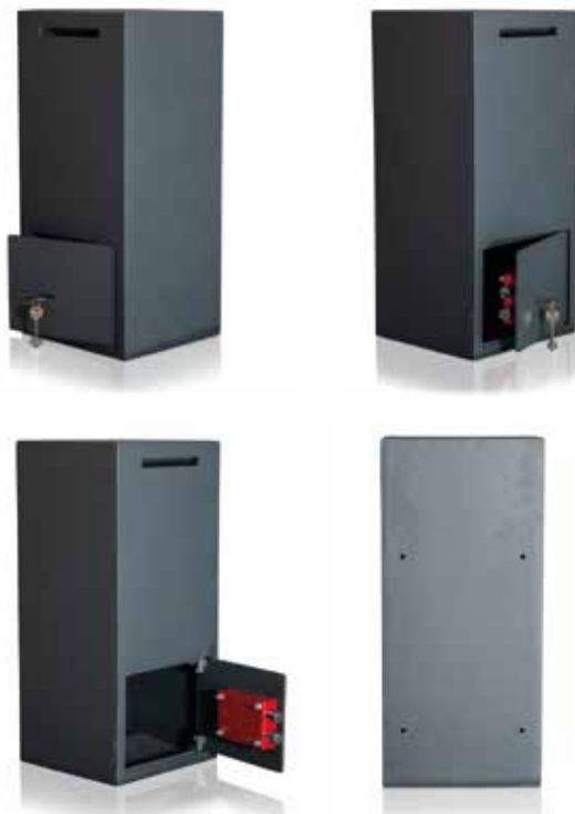
Offerblok 275x255x600 mm inwerpleuf zijkant met anti-hengelbeveiliging 1300085.000 € 531,00 per stuk