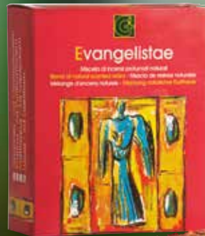
Wierook Lucas 300 gram 1 doos 1320003.000