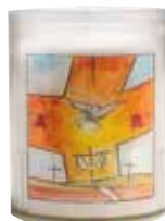
Paaswakekruisje R251 RESURREXIT, SICUT DIXIT