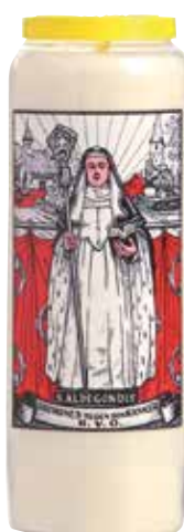
Heilige Aldegondis 0745034.000