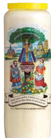
O.-L.-Vrouw van Scherpenheuvel ● 0745018.000