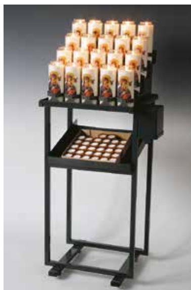
Kleine offertafel 20 novenen 1300032.000