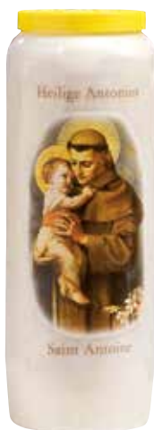
Heilige Antonius ● 0745020.000