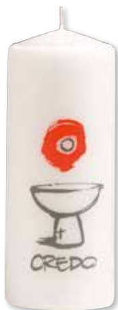
Communie/Vormsel 1 ● karton x 6 stuks 0060013.001