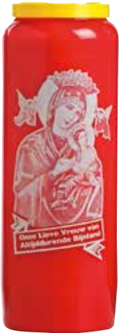
O.-L.-Vrouw van Altijdurende Bijstand (1 kleur) 0745009.000