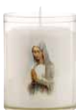
O.-L.-Vrouw Standaard karton x 60 stuks 0845014.000