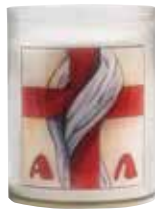
Paaswakekruisje R249 LINTEUM 0845125.000