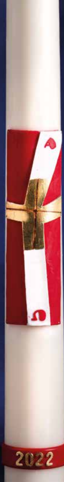
R248 - CRUX