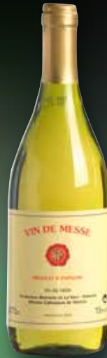
Zoete miswijn 15° 75 cl karton x 12 flessen 1320002.000