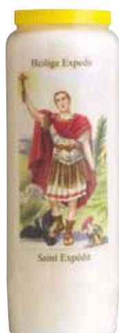
Heilige Expedit ● 0745032.000