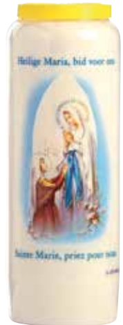
O.-L.-Vrouw van Lourdes ● 0745012.000