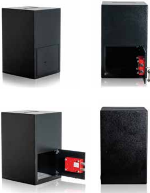
Offerblok 280x300x450 mm inwerpleuf bovenkant met anti-hengelbeveiliging 1300084.000 391,00 per stuk