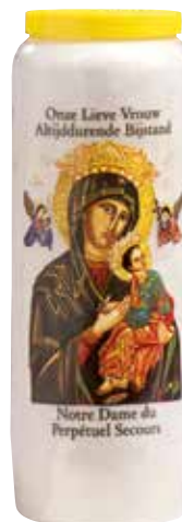
O.-L.-Vrouw van Altijdurende Bijstand ● (4 kleuren) 0745008.000