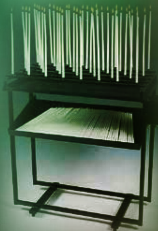
Grote offertafel 38 offerkaarsen 1300010.000