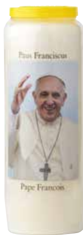
Paus Franciscus 0745063.000