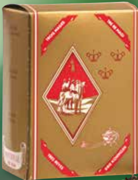
Wierook Pontifical 500 gram 1 doos 1320000.000