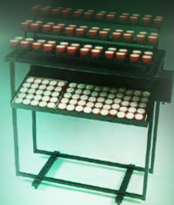
Grote offertafel 72 devotielichten 1300011.000