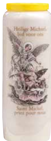
Heilige Michael ● 0745022.000