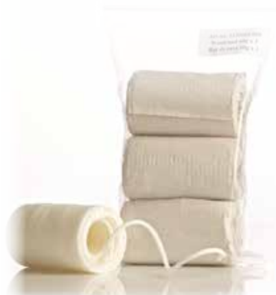
Wasdraad 3 x 60 gram zak met 3 rollen van 10 meter 1130004.000