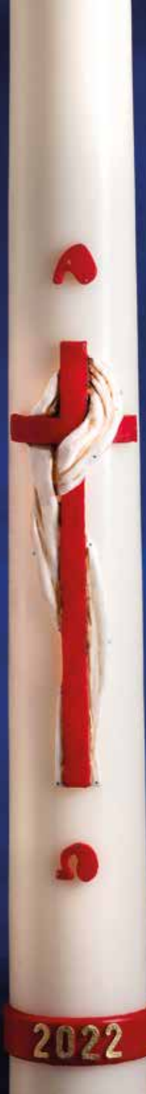
R249 - LINTEUM