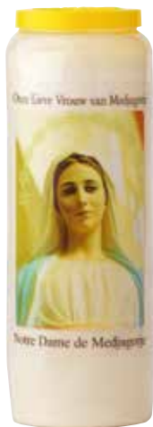
O.-L.-Vrouw van Medjugorje 0745014.000