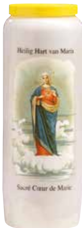
Heilig Hart van Maria ● 0745002.000