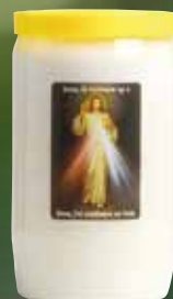
Jezus, ik vertrouw op u karton x 20 stuks 0713105.000