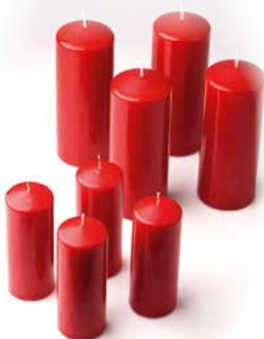
Adventskaarsen 0053201.013 – 60/150 mm karton x 12 stuks 0073201.013 – 80/200 mm karton x 6 stuks