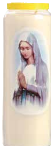
O.-L.-Vrouw Standaard wit 0745006.000