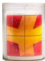
Paaswakekruisje R248 CRUX