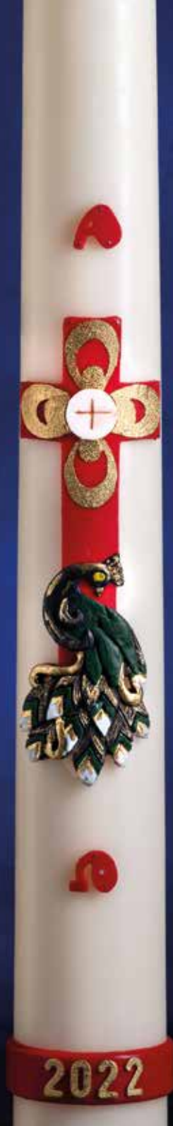
R255 - PAVO