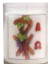
Paaswakekruisje R253 VITIS VINIFERA

De wijnstok (‘Vitis vinifera’ in het Latijn) is ook weer zo een oersymbool in de christelijke kunst en cultuur. Hier vormen de takken van de wijnstok het Chi-Rho-symbool en vallen de druiven er decoratief omheen, ze omarmen het. Het is een dubbele verwijzing naar Christus. De wijnstok, naar de zin uit het Johannesevangelie (Joh. 15:1-8) waar Jezus tot zijn leerlingen zegt: “Ik ben de ware wijnstok en Mijn Vader is de wijnbouwer” en het Chi-Rho-symbool dat verwijst naar de naam van Christus. Deze decoratie heeft echt iets feestelijk en rijkelijk, het feest van Pasen eigen.