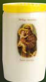
Heilige Antonius karton x 20 stuks 0714020.000