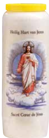
Heilig Hart van Jezus ● 0745001.000