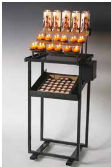
Kleine offertafel combi 5 novenen + 24 devotielichten 1300033.000