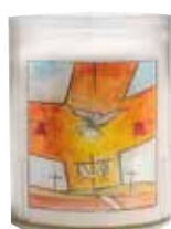
Paaswakekruisje R251 RESURREXIT, SICUT DIXIT 0845127.000