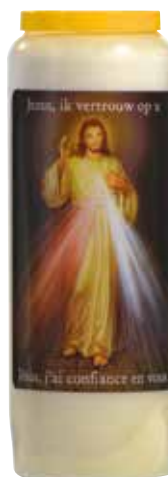
Jezus, ● ik vertrouw op u 0745060.000