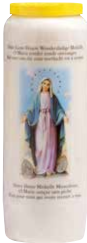
O.-L.-Vrouw Wonderdadige Medaille 0745010.000