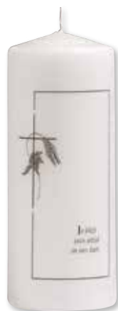
Uitvaart 2 karton x 12 stuks 0055116.001

De gelegenheidskaarsen die zijn aangeduid met een ● zijn individueel verpakt in een mooie doorzichtige blister of een wit transparant organza cadeaubuideltje.