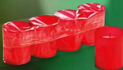
Devotielichten 36A rood verpakt per 4 0845008.000