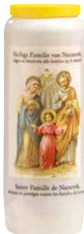
Heilige Familie 0745003.000