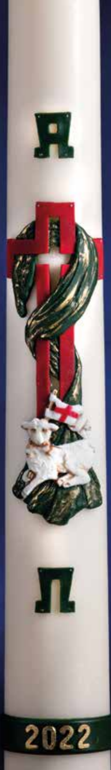
R254 - AGNUS DEI