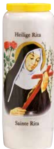
Heilige Rita ● 0745019.000