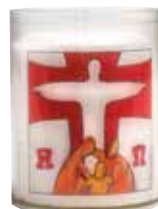
Paaswakekruisje R252 CRISTO REDENTOR

Christus de Verlosser (in het Portugees ‘Cristo Redentor’) is een groot standbeeld van Jezus Christus in de wijk Alto da Boa Vista in de stad Rio de Janeiro in Brazilië. In deze versiering voor de Paaskaars heeft de ontwerper het silhouet van dit standbeeld centraal in haar ontwerp geplaatst met aan de voet van het kruis de vierende gemeenschap, die in geloof met elkaar verbonden zijn. De Paaskaars als symbool voor ‘de kracht van verbinding’ en voor de vreugde voor Christus, de Verlosser van de wereld.