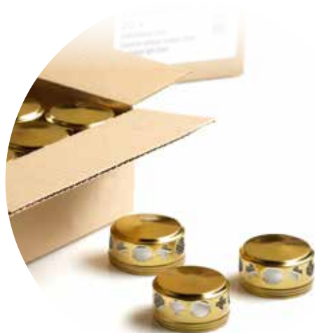
Graflichtdeksels 55 mm karton x 20 stuks 1305004.000