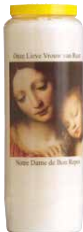
O.-L.-Vrouw van Rust 0745016.000