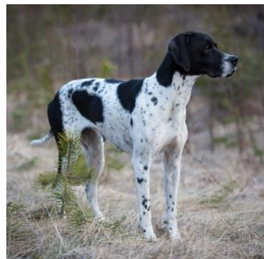
P Borgeflons BS Agda – Reino Unosson