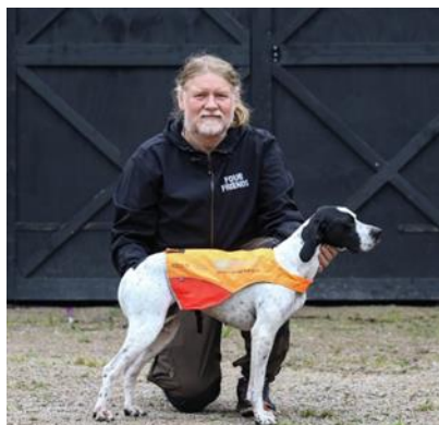
Borgeflons RX Blanka du Nord – Trond Johannessen