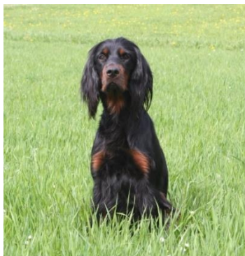
GS Endalshöjdens Dolly Parton – Jean Marc Chabloz