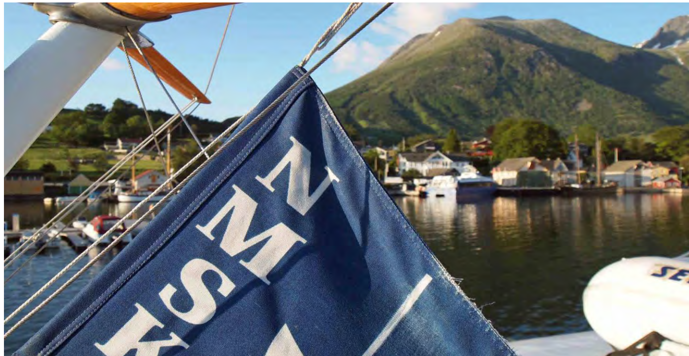
(MY Antares i Rosendal, Hardangerfjorden)