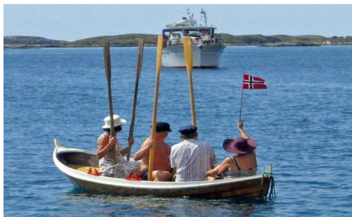
Velkomst på Helgeland – i godvær!